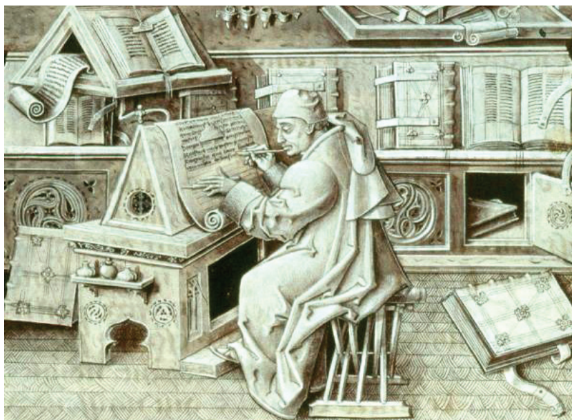
Slika 2: Pisar v skriptoriju Vir: Wikipedija. Miracles de Notre Dame, fol. 19; po 1456. https://sl.wikipedia.org/wiki/Skriptorij#/media/Slika:Escrignano.jpg

Pisanje je dolgo časa pomenilo tudi poklic (zelo cenjen zaradi majhnega števila ljudi, ki so obvladali to večino), ki se je, vse do iznajdbe tiska (leta 1457 izide prvo delo, ki nosi tiskarski znak), širilo zgolj z ročnim pisanjem ali prepisovanjem starejših spisov. Dokaze o pisarjih, ki so svoje znanje prenašali na učence, najdemo že v Mezopotamiji in Egiptu. V organiziranosti pisarskega poklica Barthes vidi odnos med pisavo in gospodarstvom ter politiko. Šibkejša menjava in trgovinska kriza sta zmanjšali potrebo po luksuznih knjigah, propadanje administracije je povzročilo upad pisanja in je zmanjšalo njegovo vrednost. Zato se je v 6. in 7. stoletju po našem štetju kopiranje rokopisov prestavilo v samostane – v delavnice, imenovane scriptoria. Monopol nad pisavo je imela zato duhovščina vse do 13. stoletja, ko je umetnost pisanja prešla v laični svet. Posvetni pisatelji (ki sodelujejo z menihi) se postopoma organizirajo v združenja, ki imajo svoje statute in privilegije. Zaradi krepitve administracije, vrnitve romanskega prava, širjenja notariata, uvajanja birokracije in razvoja bančništva se je potreba po pisanju ponovno povečala. Nastajale so nove oblike zapisanih del: filozofske razprave, razprave iz logike, matematike in astronomije, kuharski, zdravstveni, vzgojni in drugi priročniki, celo romani. Izdajanje knjig ni več zgolj v rokah plemstva in duhovščine, ampak so namenjene širši množici.