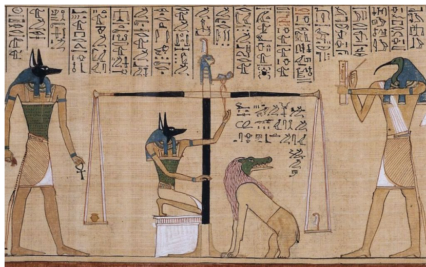
Slika 1: Prizor iz Knjige mrtvih (Papiрус Hunefer, XIX. dinastija, obdobje Setija I., 1313-1301 pr. n. št.)

O pravem pomenu besede pisava pa lahko govorimo šele takrat, ko nastane organiziran sistem znakov ali simbolov, s katerim lahko uporabniki jasno zapišejo vse, kar mislijo in čutijo. Tak razvoj ne nastane čez noč, je dolgotrajen proces, zato je tudi zgodovina pisave dolga in zapletena.