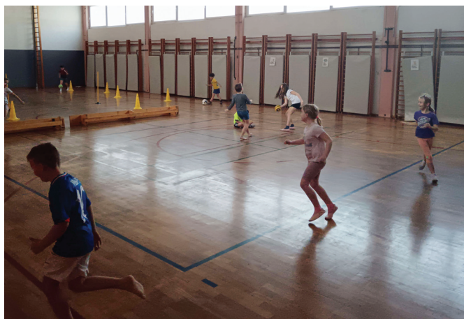
► SLIKA 3: Izbrane dejavnosti.