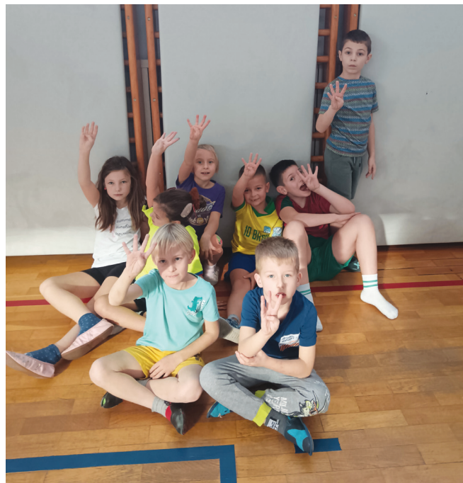
► SLIKA 7: Samoocenjevanje

Kljub temu da učenje in poučevanje po načelih formativnega spremljanja za učitelja na začetku pomeni dodatno