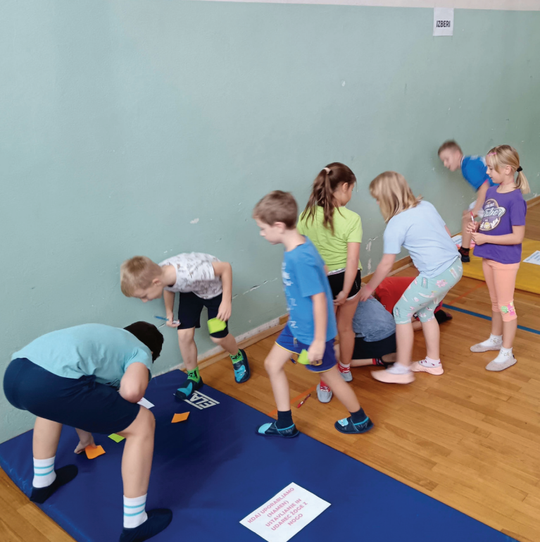
► SLIKA 1: Izbiranje sklopov spretnosti.