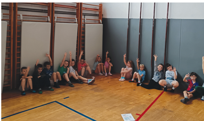
► SLIKA 6: Pogovor o tem, kaj so se naučili, s čim so zadovoljni in kaj bi še želeli izboljšati.