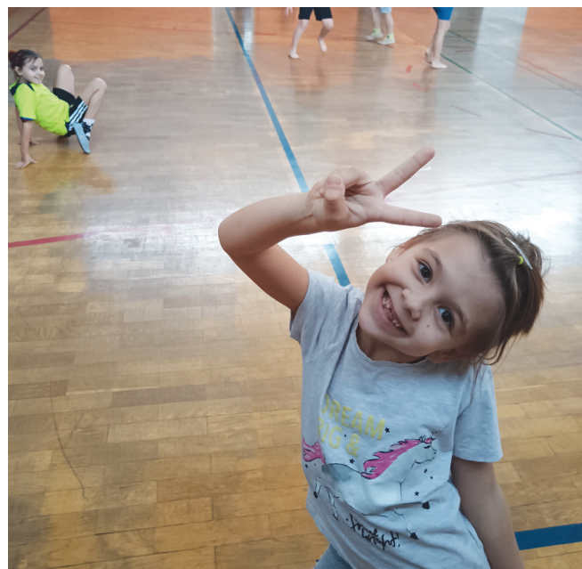
► SLIKA 8: Veselje po opravljenih dejavnostih.

učenje in spremembo v načinu razmišljanja, opažam, da so rezultati dosežkov učencev boljši, učenci pa pri delu bolj motivirani in zadovoljni. To pa je tisto, kar je cilj slehernega učitelja.