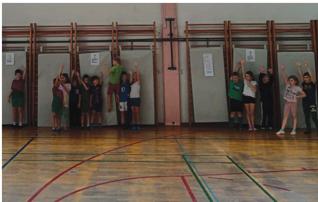
► SLIKA 5: Učenci ocenjujejo, kako uspešni so bili.