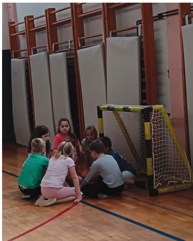
► SLIKA 4: Pogovor o uspešnosti izvedbe dejavnosti.

Učenci so se ocenili tako, da so se postavili k listu, ki je predstavljal njihovo uspešnost, in dvignili toliko prstov, kot je pisalo na ocenjevalnem listu. Po samoocenjevanju smo se pogovorili, kaj menijo, da bi lahko naredili bolje. S preverjanjem so razmišljali o izvedbi in se s tem učili pravilne izvedbe.