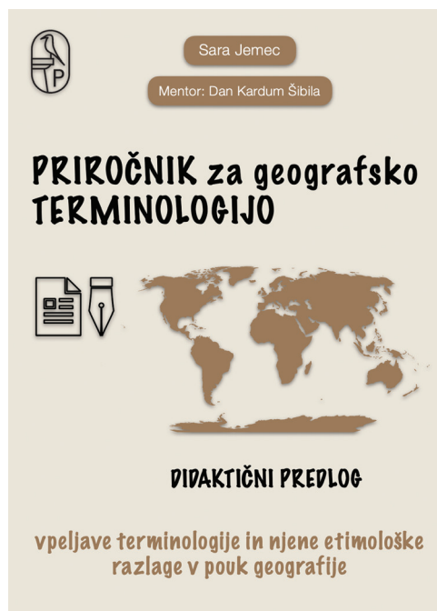
Slika 1: Naslovnica Priročnika za geografsko terminologijo

Priročnik je osnovan na predhodno opravljenih raziskavah teoretičnega dela, kjer smo analizirali temeljne značilnosti etimologije, terminologije, učenja in poučevanja besedišča z vidika delovanja mentalnega leksikona