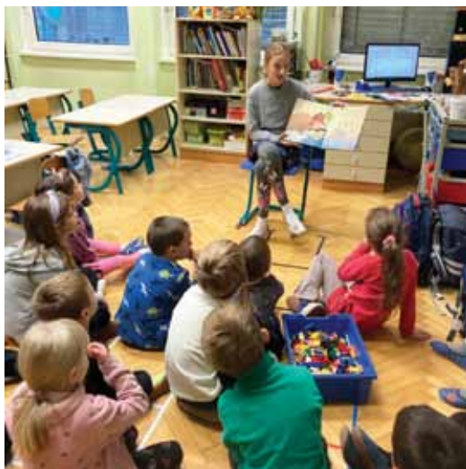
Slika 9: Učenka bere pravljice v jutranjem varstvu. Foto: Nataša Logar Andič, 2023.