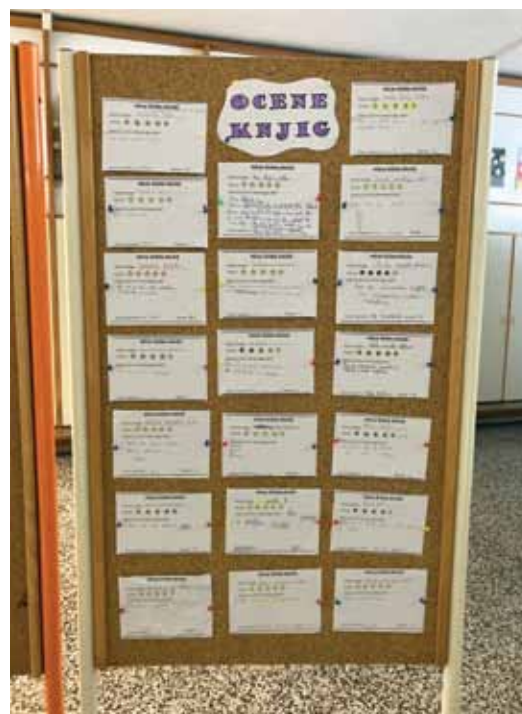
Slika 5: Postani knjižnični detektiv in reši skrivnostno uganko Avtorica: Nataša Logar Andič, 2023.