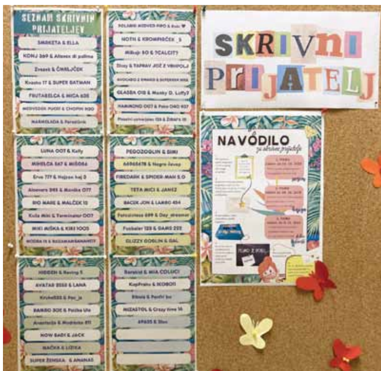
Slika 4: Skrivni prijatelj

Tudi v šolskem letu 2023/2024 smo za učence pripravili detektivsko igro knjižnični detektiv. V knjižnici so morali izpolniti pripravljen delovni list. Delovna lista sta bila dva – za starejše učence od 6. razreda naprej ter za mlajše učence od 2. do 5. razreda. Učenci so morali na knjižnih policah najprej poiskati določeno leposlovno knjigo in iz nje izpisati zahtevane podatke. Nato so morali izvesti določene gibalne vaje (poskoki, predkloni, počepi), da so poleg možganov razgibali še svoje telo. Po izvedenih vajah so morali na policah poiskati še eno poučno knjigo. Ko so jo našli, so se podali v pritličje šole oziroma v prvo nadstropje šole, kjer so našli nadaljnja navodila – morali so rešiti rebus in rešitev povedati knjižničarki. Za zaključek so morali poiskati še drugo leposlovno knjigo, v kateri so našli detektivsko uganko (iz knjige Skrivnostne uganke: preizkusi svoje možgančke in razvozljaj 25 skrivnostnih zgodb ).