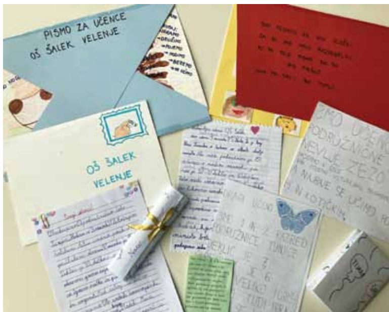
Slika 3: Pisma za partnersko šolo

priložijo pesem, ki jim je všeč, v drugem pismu svojemu skrivnemu prijatelju priporočajo knjigo, ki so jo prebrali, v tretjem pismu pa naštejejo vsaj pet svojih dobrih lastnosti. Ko učenec prejme pismo od svojega skrivnega prijatelja, ga obvestilo čaka pred knjižnico, knjižničarka pa mu izroči pismo. Po počitnicah se razkrijejo skrivni prijatelji in tisti, ki so napisali in prejeli tri pisma, so nagrajeni. Dejavnost je zanimiva, saj se učenci tako še bolj spoznajo, bolje pa jih spozna tudi učiteljica. Učencem je igranje skrivnega prijatelja zelo všeč in se dejavnosti z veseljem udeležijo.