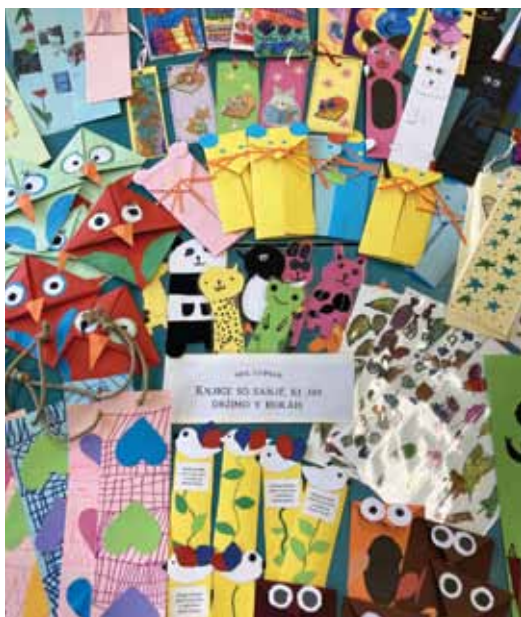
Slika 2: Knjižne kazalke Foto: Nataša Logar Andič, 2023.