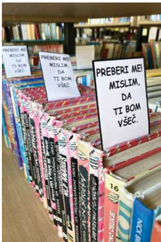
Slika 7: S kazalkami označene knjige

vodi k pogostejšemu in vseživljenjskemu branju, poveča pa se tudi bralna in učna učinkovitost. Več otrok se je odločilo, da se bodo izziva lotili. Nekateri so si število knjig povečali, drugi pa zmanjšali. Zanimivo jih bo na koncu šolskega leta vprašati, ali so cilj dosegli.