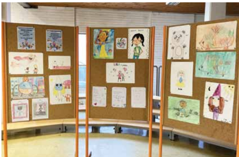
Slika 1: Razstava likovnih in literarnih del

šola. Naslov natečaja se je glasil Šolska knjižnica – moj srečni kraj, kjer ustvarjalnosti in domišljiji ni meja. Učenci so lahko narisali svojega najljubšega knjižnega junaka, lahko pa so tudi napisali pesmico ali pravljico na temo šolska knjižnica – moj srečni kraj. Mlajši učenci so večinoma narisali knjižne junake, starejši pa so se lotili pisanja pesmic in pravljič. Prejeli smo več kot 160 izdelkov. Na Albrehtov dan smo na krajši prireditvi razglasili šest nagrajencev, ki so prejeli lepe nagrade in pohvale. Slovesno jim jih je izročila ravnateljica. Pohvale za sodelovanje in bombončke pa so prejeli tudi vsi prvošolci.