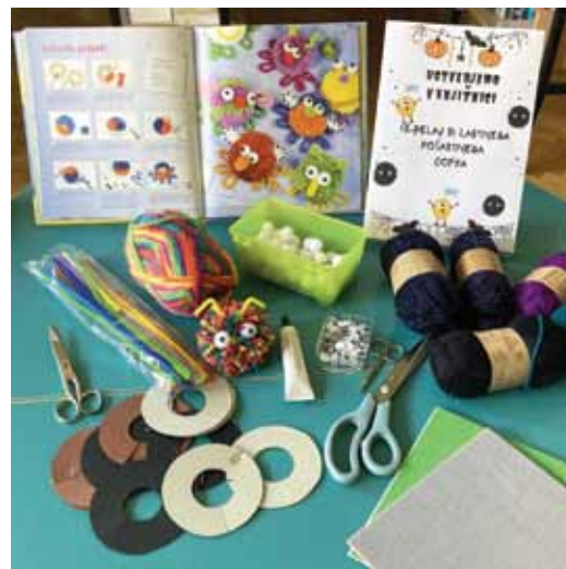
Slika 10: Izdelava pošastnih cofkov