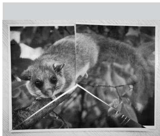
Slika 1: Primer sestavljanke

V nadaljevanju sem jih razdelila v pet heterogenih skupin s pomočjo petih sestavljanek. Vsak izmed njih je vlekel delček sestavljanke, poiskal sošolce, ki so imeli delček iste sestavljanke, in tako so sestavili sličico živali, ki jo bodo preučevali v skupini.