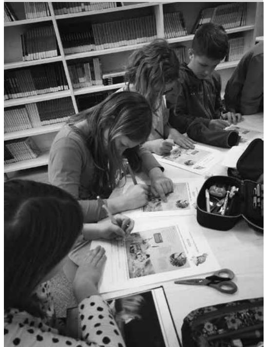
Slika 4: Reševanje nalog