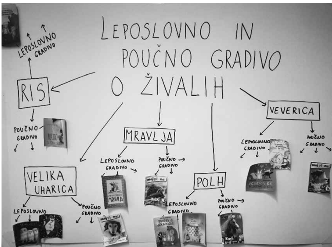
Slika 7: Pojemna shema na tabli