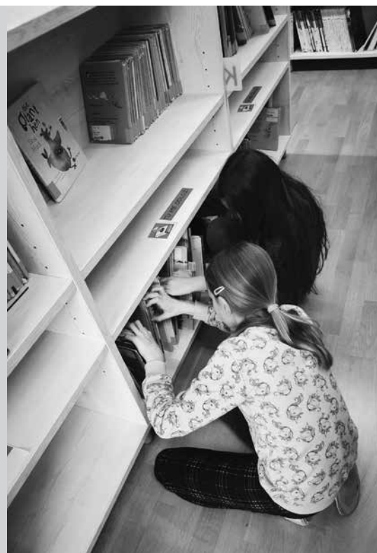
Sliki 5 in 6: Iskanje gradiva v knjižnici