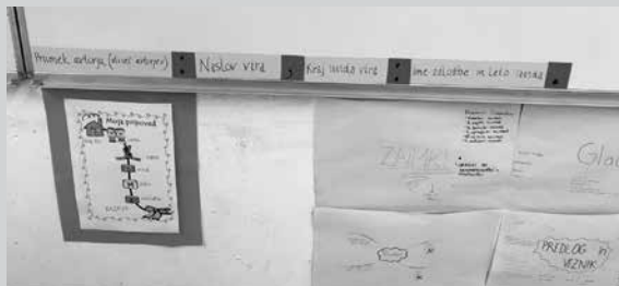
Navajanje virov na tabli