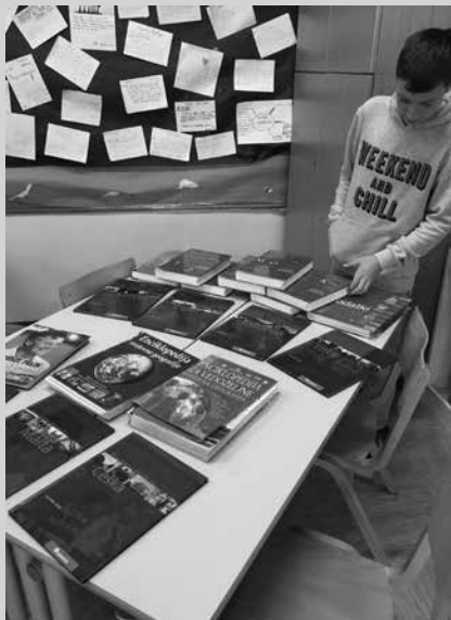
Učenec brez svojih virov si gradivo poišče v razredu.