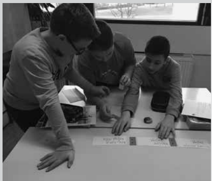
Učenci navajajo vire.