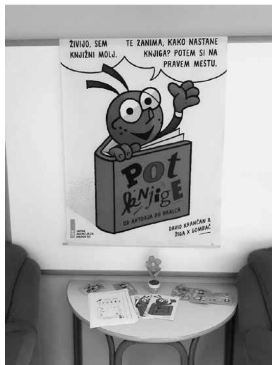
Slika 5: Uvod v razstavo

Septembra smo začetek bralne sezone za bralno značko (med drugim) otvorili z razstavo Pot knjige. Namenjena je učencem prvega in drugega VIO. Pri plakatu z naslovom Roj-