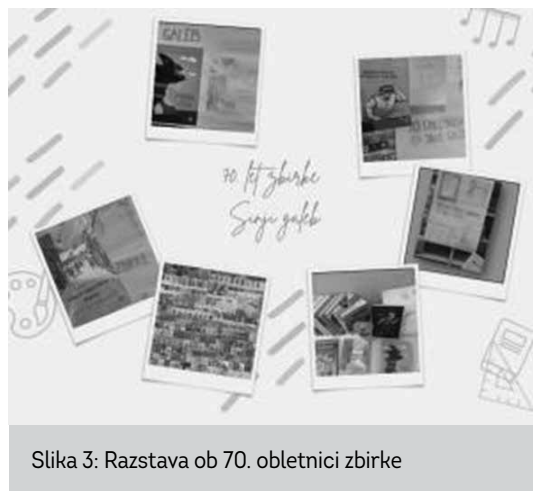
Slika 3: Razstava ob 70. obletnici zbirke

osmošolci so poustvarjali naslovnice del ob 70. obletnici zbirke Sinji galeb. Po uvodnem predavanju o osnovnem in izbirnem iskanju v katalogu Cobiss so se učenci po skupinah lotili izdelave naslovnice knjig iz zbirke Sinji galeb in oblikovanja ključnih besed, ki bi lahko bile v pomoč pri samostojnem iskanju. Ugotovili so tudi, da knjigo, po kateri je zbirka dobila ime, Bratovščina Sinjega galeba, dobro poznajo. Z nekaterimi naslovi so se srečali prvič. Nastal je plakat, ki smo ga dodali k plakatu založbe Mladinska knjiga.