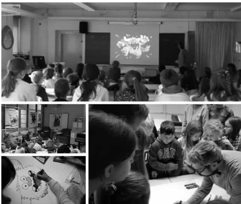
Slika 8: Obisk ilustratorja in skupno ustvarjanje

branje: »/.../ tematske razstave; bralni dnevniki; knjige za slepe; katalog šolske knjižnice; bralni prijatelj; interaktivne pravljicne vislice; ljudske pravljice tako ali drugače; raziskovalne naloge; hkratno branje v več jezikih (Kako je Oskar postal detektiv, Kokoš velikanka, Nekoč je bila idr.); Minecraft medpredmetna povezava računalništva in knjižnice itd. Zelo pomembna je tudi zaloga gradiva posamezne knjižnice ter sledenje novostim, saj aktualna literatura, ki je večkrat predstavljena ali omenjena na televiziji ali v mladinskih revijah (npr. PIL, Smrklja itd.), mlade spodbudi k temu, da knjigo primejo v roke in preberejo vsaj naslov ali hrbtno stran. Izkazalo se je, da so učence k branju pritegnile tudi najbolj iskane knjige, sveži prevodi, denimo knjige o vampirjih, Igrah lakote, Dnevnik nabritega mulca ipd., in zelo dobro je bilo, da je naša knjižnica sledila povpraševanju in tako pridobila bralca ali dva.« (Škrlj, 2018, str. 26–27) ●