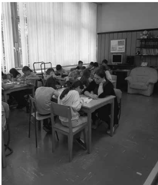
Slika 7: Reševanje učnih listov

Uporaba plakatov zelo pripomore k lažji predstavitvi nastanka knjige, avtorja, založbe, tiska, e-knjige. Seznanili so se s knjigo, napisano s pisavo za slepe, ki je del šolske knjižnične zbirke. Ugotovili so, da poznajo nekatere filme, ki so nastali po knjigah in podobno. Učencem so bili učni listi všeč, vendar jih je večina rešila le prve tri pri uri (preostale so z veseljem vzeli za kasneje). Ob ogledu razstave so se seznanili z različnimi poklici, kot so avtor, ilustrator, urednik, grafični oblikovalec, založnik, tiskar, knjigarnar, knjižničar itd.