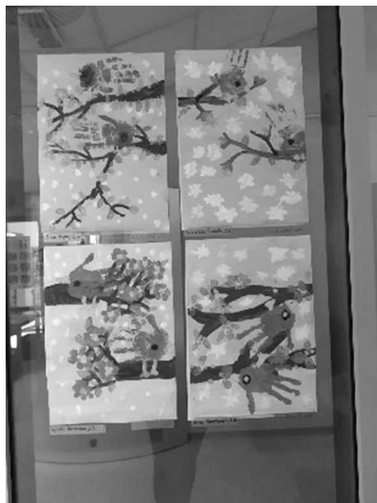
Slika 1: Primer razstave v sodelovanju z učiteljicami PB na temo pomlad

V duhu naše namere o organiziranju dogodkov v knjižnici je tudi misel, da naj bo šolska knjižnica »družbeni prostor, odprt za kulturne, strokovne in izobraževalne dogodke (npr. prireditve, srečanja, razstave, vire) za šolsko skupnost«. Šolski knjižničar bi moral prevzeti pobudo pri zagotavljanju tega, da imajo učenci tako v razredu kot v knjižnici priložnost brati gradivo, ki so ga sami izbrali, in/ali z drugimi razpravljati o tem, kar berejo, in to predstaviti tudi širši skupnosti. Učiteljem in učencem bi morali predstavljati novo leposlovno in strokovno gradivo prek pogovorov o knjigah, knjižničnih razstav in informacij o novostih na spletni strani knjižnice. V knjižnici in/ali drugih šolskih prostorih je mogoče organizirati posebne dogodke, ki dvigujejo ugled pismenosti in branja. To so lahko razstave, obiski