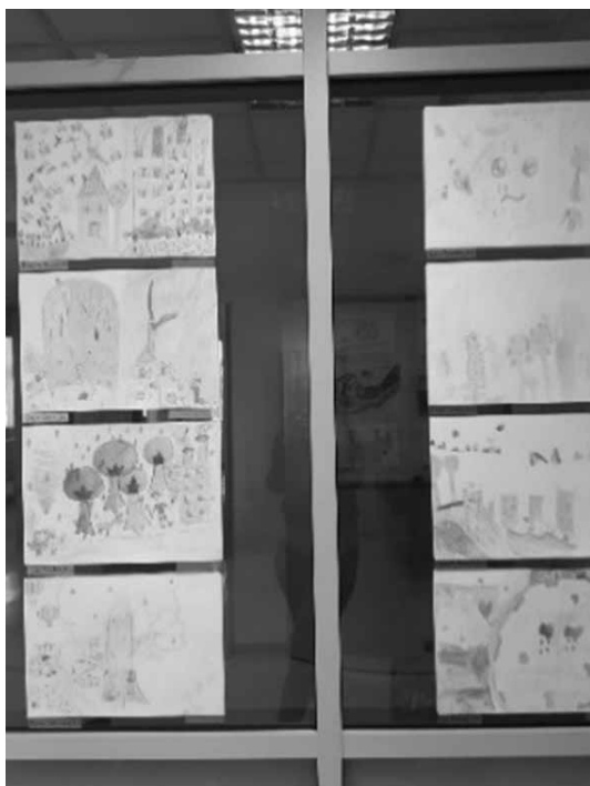
Slika 2: Primer razstave v sodelovanju z učiteljicami PB na temo onesnaževanja (svetovni dan Zemlje)

Za skupno uro v šolski knjižnici lahko uporabimo tudi tematsko razstavo, ki je uporabna in zanimiva za učence. Razstave lahko pripomorejo k dvigu bralne in kulturne pismenosti ter šolo povežejo s kulturnimi organizacijami. V šolskem letu se trudimo pripraviti več manjših priložnostnih razstav (novosti v knjižnici, bralna značka, zlata hruška, o literarnih ustvarjalcih z aktualnimi obletnicami), ki so na ogled vsaj teden dni. Nekatere razstave učenci pripravijo sami, sodelujemo tudi z učiteljicami v podaljšanem bivanju.