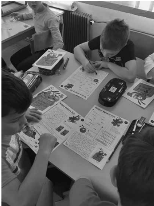
Slika 6: Reševanje učnih listov

stvo knjige sta bila izpostavljena tudi pojma knjigarne in knjižnice. Predstavljena so orodja za promocijo knjige bralcu in z njo povezane dejavnosti, nagrade, projekti. Učenci so razmišljali tudi, kaj pomeni, da knjiga zaživi, šele ko jo nekdo prebere. Pogovorili smo se, kdo sta avtor in ilustrator brošur v obliki stripov, ki so jih prejeli, ter reševali naloge z učnih listov.