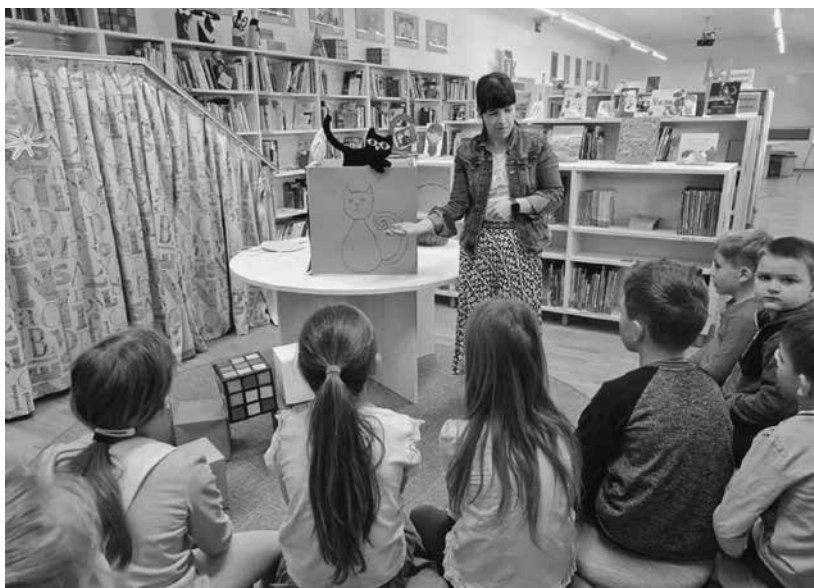
Slika 1: Pripovedovanje pravljice Hišica iz kock (E. Peroci), 2. april 2022, mednarodni dan mladinskih knjig

Oktober je čas, ko šolske knjižnice še posebej na široko odpremo svoja vrata in vabimo učence vanje, saj je oktober mesec šolskih knjižnic . Praznovanje šolskih knjižnic se je začelo že leta 1999, ko so knjižničarji