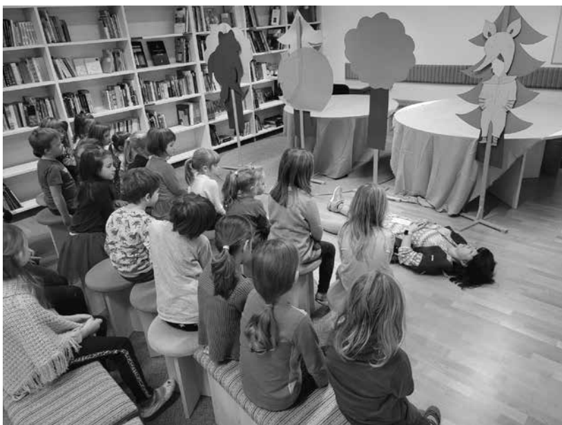
Slika 2: Pripovedovanje zgodbe Kako objeti ježa (J. Bauer), november 2022

Po končani pripovedi učence z vprašanji spodbudim, da se vživijo tudi v čustva junakov, saj bodo le tako lahko razumeli druge in razvili empatijo.