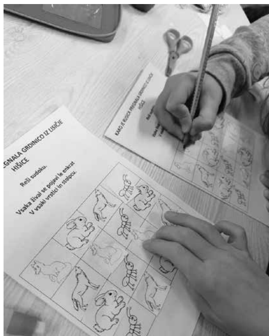
Slika 5: Sudoku

Spet druga izmed nalog je bila: Nariši grdino. Ker je grdina izmišljen lik, se mi je zdelo zanimivo, da vsak izmed učencev nariše drugačno grdino.