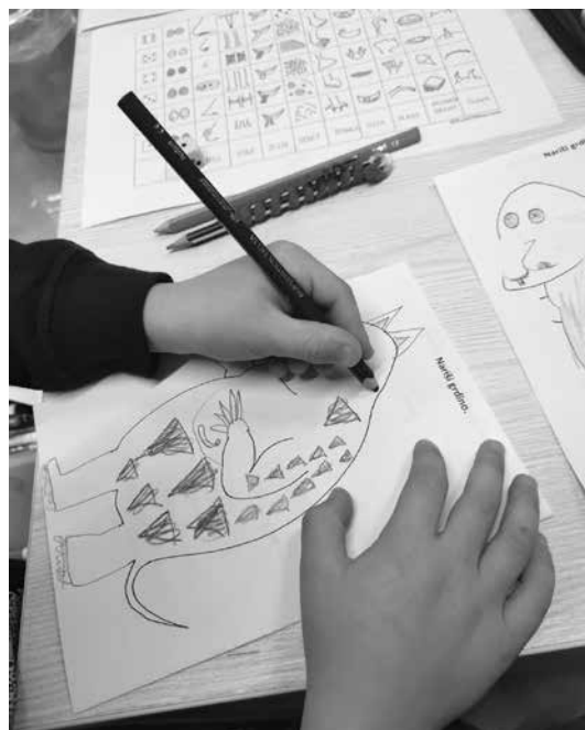
Slika 7: Risanje grdine s pomočjo igralne kocke

Spet druga izmed nalog je bila: Nariši grdino. Ker je grdina izmišljen lik, se mi je zdelo zanimivo, da vsak izmed učencev nariše drugačno grdino. Da pa naloga ne bi bila preveč preprosta, smo jo popestrili z igralno