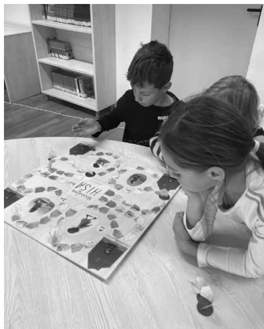
Slika 11: Družabna igra z naslovom Kala išče svojo nevidno hiško

Na prvi postaji je bila igra, podobna igri človek, ne jezi se, v kateri so učenci potovali čez prepreke, da so dosegli svojo nevidno hiško. Igra je namenjena 4 učencem, vsak izmed njih pa potuje po svoji poti.