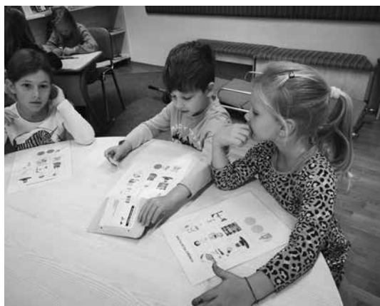
Slika 13: Družabna igra bingo