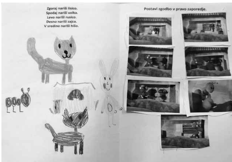
Slika 6: Naloga postavi sličice v pravo zaporedje