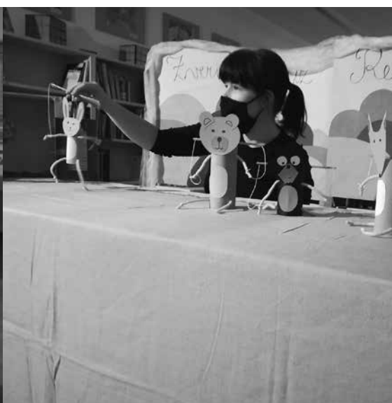
Sliki 3 in 4: Lutkovna predstava po motivih slovenske ljudske basni iz Rezije Kako je rusica pregnala grdinico iz lisičje hišice, oktober 2021