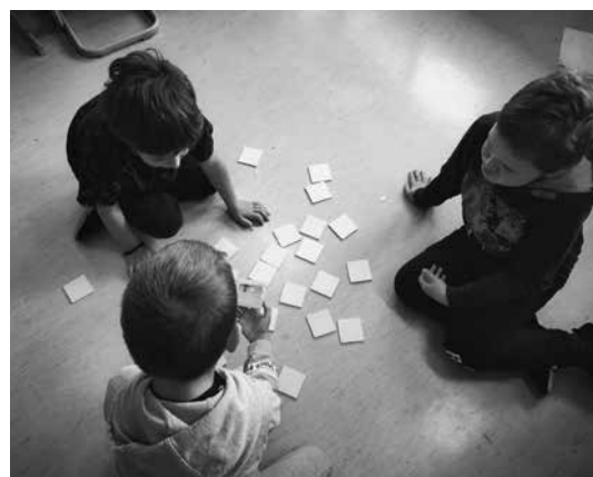
Slika 12: Družabna igra spomin

Na drugi postaji so se preizkusili v igri spomin. Spomin je bil sestavljen iz 15 parov. Sličice so bile vzete iz same knjige.