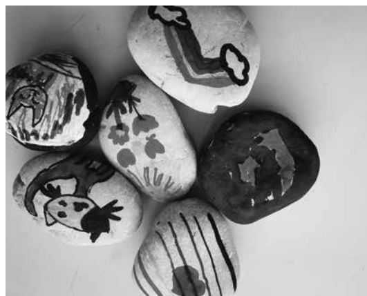
Slika 14: Kamenčki za srečo

Na zadnji postaji pa so učenci z alkoholnimi flomastri risali na kamenčke. Kamenčke smo poimenovali kamenčki za srečo.