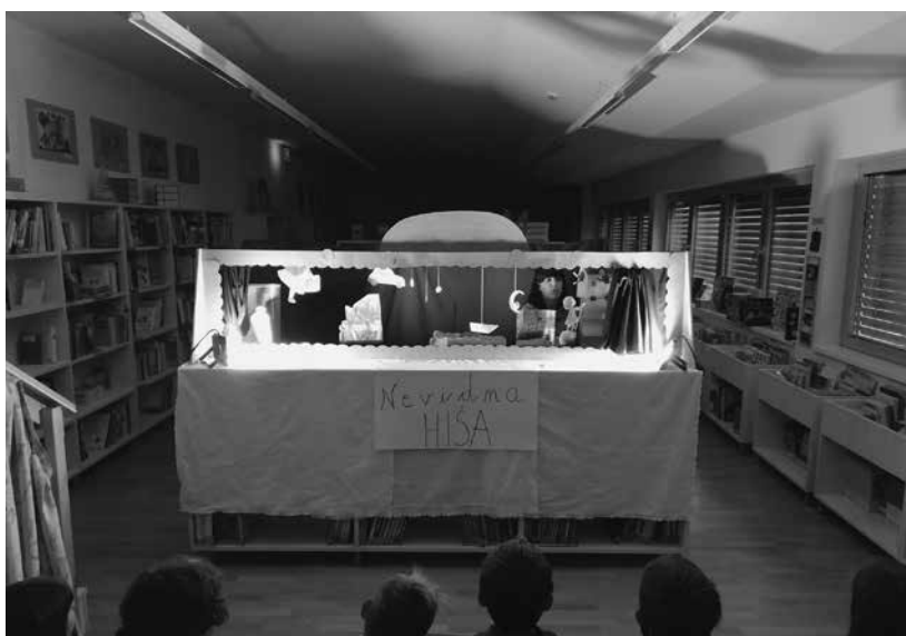
Slika 10: Lutkovna predstava po motivih iz zgodbe Nevidna Hiša (B. Crvenkovska), oktober 2022

Za učence sem pripravila pripovedovanje z lutkami, obogateno s pevskimi točkami. Z učenci smo pred samim pripovedovanjem spregovorili o domu, begunstvu in vojni. Učencev se je zgodba zelo dotaknila.