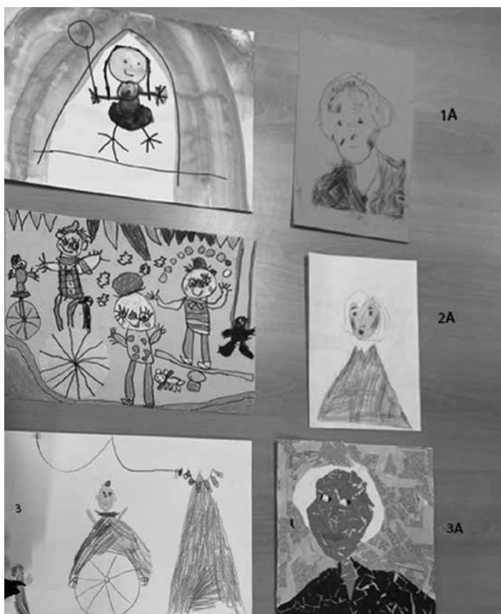
Slika 2: Nagrajeni likovni prispevki