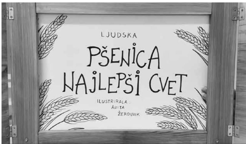
Slika 4: Ljudska pravljica »Pšenica, najlepši cvet«, ki jo je za potrebe zaključne prireditve ilustrirala devetošolka OŠ Horjul Anita Žerovnik.

Predvidena je tudi objava e-zbornika z vsemi prispelimi izdelki.