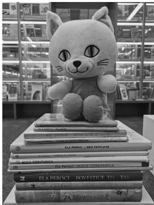
Slika 1: Knjige pisateljice Ele Peroci

in poleti z dežnikom v pravljično deželo Klobučarijo, kjer z Vsevidovo pomočjo najde tudi žogo, ki ji je padla v vodo. (Založba Mladinska knjiga, 2022)