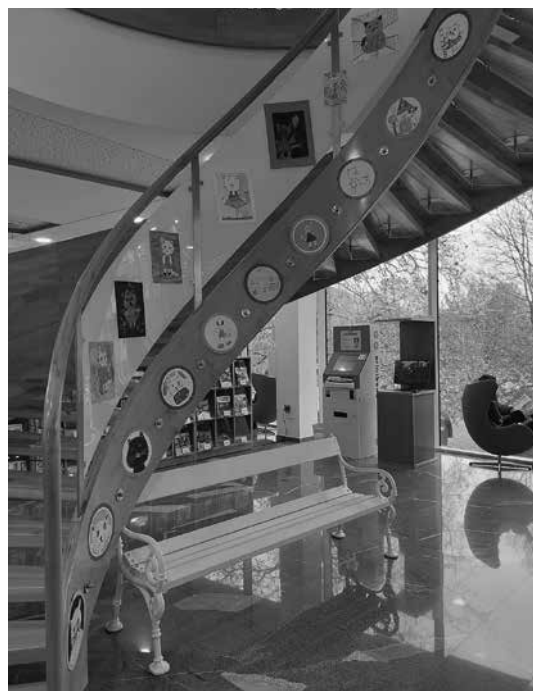
Slika 6: Nagrajeni mačji portreti