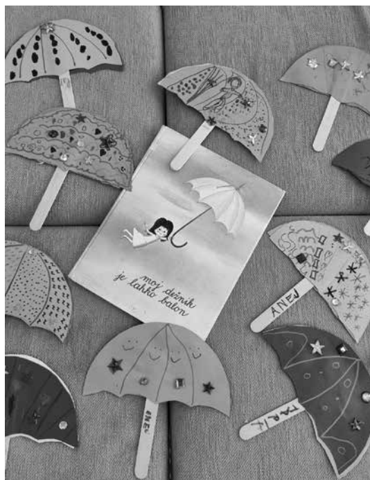
Slika 3: Pravljično ustvarjanje po literarni predlogi Moj dežnik je lahko balon