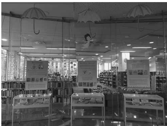
Slika 7: Razstava Med pravljice