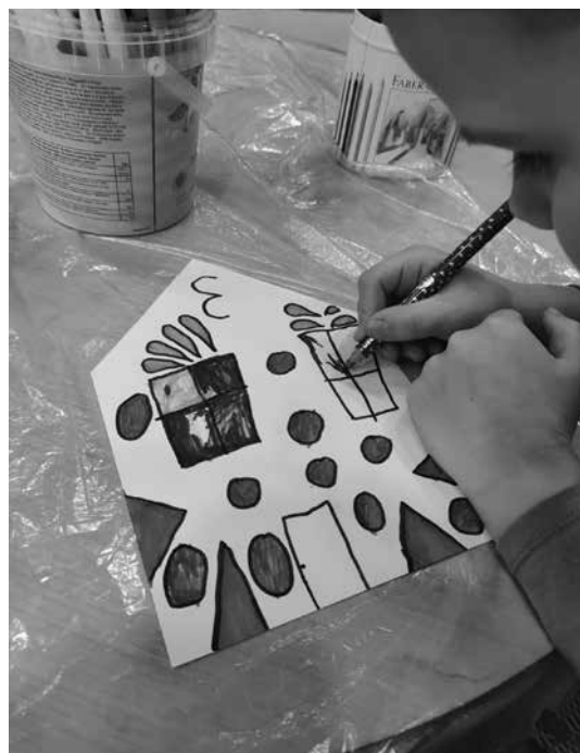
Slika 4: Pravljično ustvarjanje po literarni predlogi Stara hiša št. 3