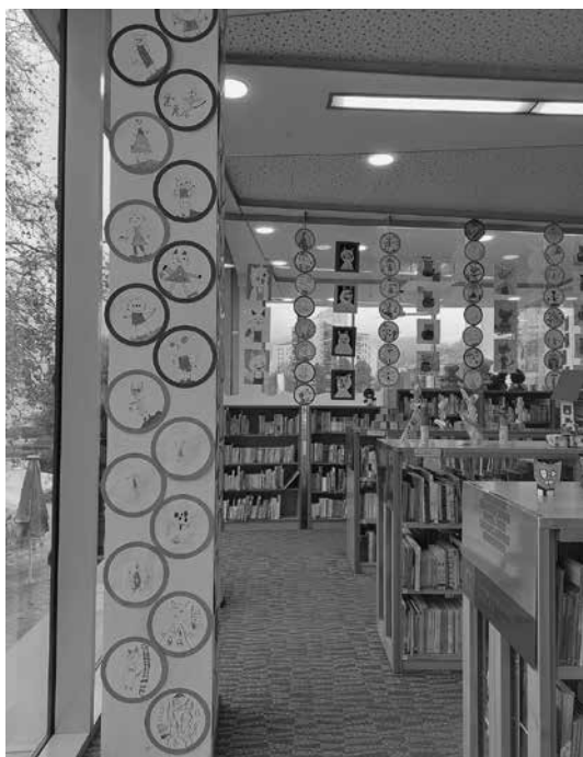
Slika 5: Razstava mačjih portretov v Knjižnici Velenje

V projektu je sodelovala večina šol in vrtcev področja, ki ga pokriva naša knjižnična dejavnost, in odziv le-teh je pozitiven, saj se nekateri mentorji branja osnovnih šol že obračajo na nas z željo po sodelovanju v nadaljnjih bralnih