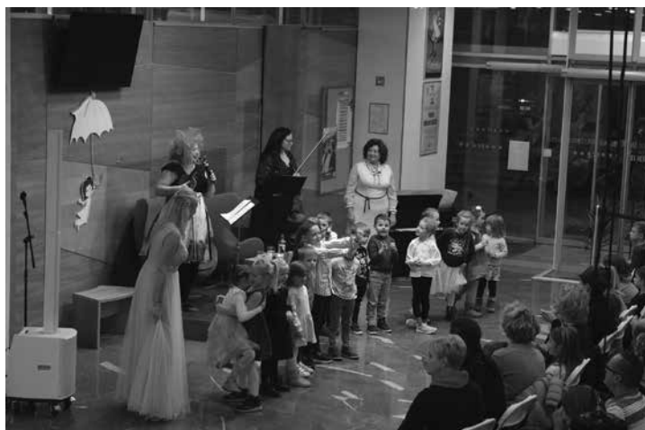
Slika 8: Zaključna prireditev in otvoritev razstave Med pravljice

projektih oz. dejavnostih za skupine otrok, ki potrebujejo dodatne spodbude za branje in obisk knjižnice.