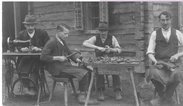
Čevljarji na razglednici iz leta 1914.

Predhodnica vajenske šole v Tržiču je bila nedeljska ponavljalna šola, ki je obstajala že v prvi polovici 19. stoletja. Obvezno so jo morali obiskovati vsi tržiški rokodelski vajenci. Osnovni namen izobraževanja je bil doseči, da bi se vajenci lepo vedli in bi bilo njihovo življenje moralno čim bolj neoporečno. Zato so v začetni dobi poučevali predvsem veronauk. Učni program se je z leti dopolnjeval s predmeti, kot so branje, računstvo, lep opis, spise, slovensko in nemško branje, pisanje, pravorečje. Vendar tako bogat pouk ni trajal dolgo. Že iz spričevala iz leta 1872