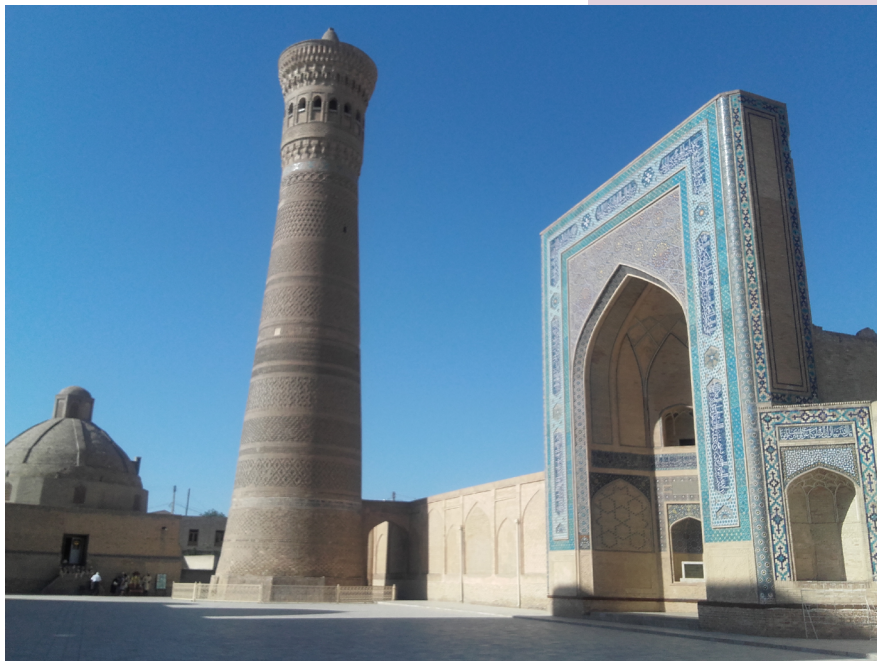
Glavni trg v Buhari v Uzbekistanu. V ospredju je minaret Kalon, simbol mesta.

Ob koncu 19. stoletja je na družbeno sceno stopil tudi ženski svet. Qasim Amin 14 je bil reformator na področju »osvoboditve« žensk. Na to temo je objavil več knjig. Pomemben je tudi kot intelektualec, ki je bil prepričan, da religija sama po sebi ne more ustvariti države in družbe. Religija je pomemben dejavnik civilizacije, vendar ne edini. Žensko gibanje v Egiptu je imelo v tem času močnega glasnika tudi v Huda Sha'arawi (1879–1947). 15 Leta 1923 je ustanovila egipčansko žensko gibanje, ki je kmalu postalo vsearabsko gibanje. Bila je tudi urednica dveh časnikov, ki sta izhajala v francoskem in arabskem jeziku in v katerih se je zavzemala predvsem za napredek in izobrazbo žensk. S svojo edinstveno mešanico zahodnega feminizma, običajev in kulture svoje države ter egipčanskega nacionalizma je vplivala na milijone Arabcev in tudi Nearabcev po vsem svetu.