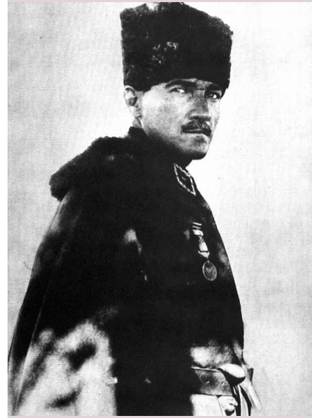
Mustafa Kemal, od leta 1935 imenovan Atatürk , prvi predsednik Turčije. S številnimi reformami je moderniziral državo.

Proces evropske kolonizacije Azije se je začel že v 17. stoletju, ko so evropske države začele ustanavljati trgovske družbe. Njihova naloga je bila širiti evropski ekonomski vpliv. Taka oblika kolonizacije je bila samo ekonomsko-komercialne