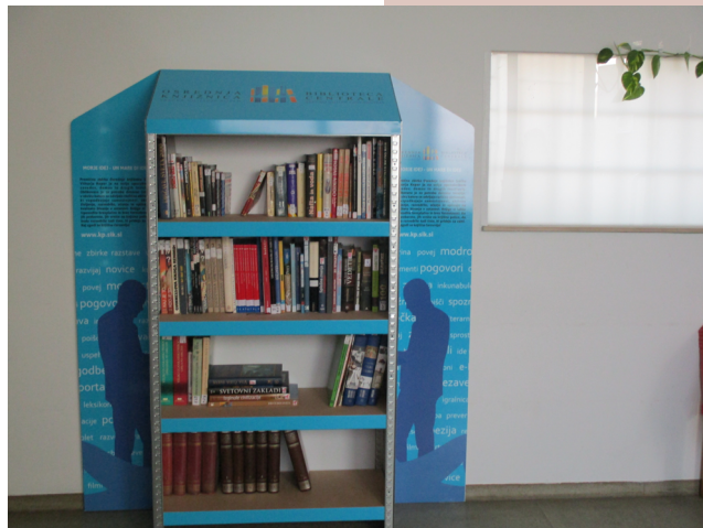
Knjige za odmik v drugi svet /... / Nova knjižna polica v Zavodu za prestajanje kazni zopora Koper

V prispevku je navedena Lippmanova definicija stereotipa, ki pravi, da je stereotip neke vrste »predstava v naši glavi«, oblikovana na podlagi prepričanj, stališč, socialnih kategorij ali vzorcev, odvisno od tega, kaj je uporabniku stereotipov bolj domače (Nastran Ule, 1999, str. 73). Pomemben je poudarek, da stereotipi lahko variirajo, saj so odvisni od družbenega konteksta, ki je podvržen spreminjanju. Očitno je dejstvo, da pripadamo neskončni raznolikosti družbenih skupin, ki imajo različne interese, vrednote, potrebe in prepričanja. Če ne bi bilo teh razlik, bi bilo delovanje antropologije, sociologije in zgodovine brez smisla in nepotrebno, meni Nastran Ule (1999). S pomočjo teh znanosti in področij se ljudje učimo raznolikosti in večplastnega družbenega dojemanja posameznika v svetu. Vprašanje, ki se zastavlja, je, do katere mere nam to uspeva.