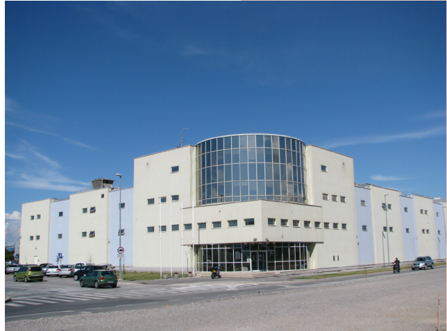
Zavod za prestajanje kazni zapora Koper. Poslopje zapora predstavlja moderno kompleksnejšo arhitekturo, ki ne daje občutka odrinjenosti, nesocializiranosti.

Če lahko predsodek opredelimo kot sodbo, ki je sprejeta, čeprav zanjo ni dokazov, pa za stereotip velja, da je posplošen pogled na skupino (Banjac, Šipuš, 2021, str. 29). Tako predsodki kot stereotipi naj bi bili načeloma slabi, saj poenostavljajo in