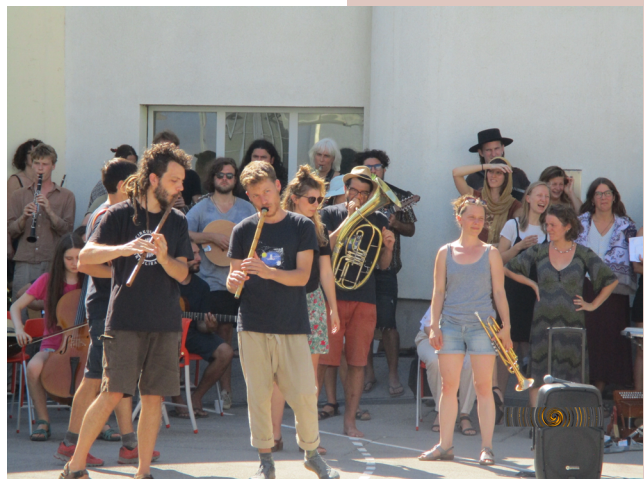
Koncert Etno Hist(e)ria v Zavodu za prestajanje kazni zapora Koper. Iskreno sodelovanje mladih z ljudmi, ki naj bi bili na obrobju.