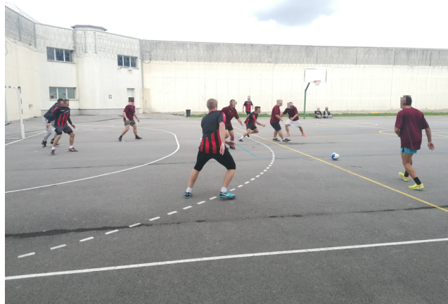
Duha ohranjamo s športnimi dejavnostmi in druženjem. Nogometna tekma v Zavodu za prestajanje kazni Koper.

Opređeljena je kot »nezaželena drugačnost«, »uporablja se za lastnost, ki je hudo diskreditirajoča« (Hoffman, 2008, str. 12). »Mednje štejejo tudi psihiatrični bolniki, istospolno usmerjeni ljudje, Romi, brezdomci, cirkusanti idr.« (Hoffman, 2008, str. 12) V istem delu avtor nadaljuje, da nezavedno lahko obstaja odklonski odnos tudi do skupin, ki navzven delujejo popolnoma sprejemljive, pa jih posamezniki kljub vsemu doživljajo odklonsko. V te skupine npr. spadajo politični radikalci, bogataši, homoseksualci, pripadniki druge verske skupine ali pa celo neporočeni in poročeni, ki nimajo nič otrok. Hoffman v svojem delu kot stigmatizirane omeni celo posameznike, ki se intenzivno predajajo enemu od hobijev, npr. filatelisti, igralci tenisa, ekstremni športniki (povzeto po: Hoffman, 2008, str. 126).