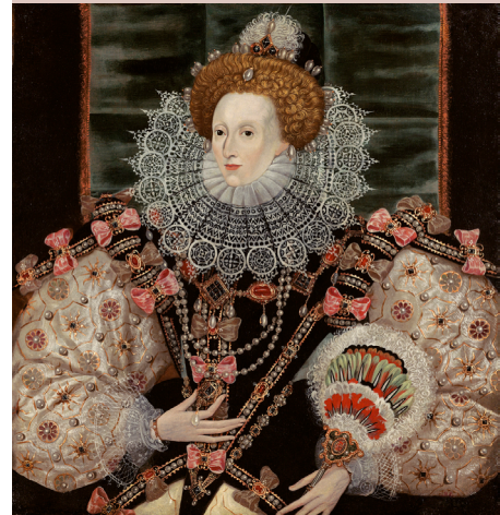
Kraljica Elizabeta I. (1533–1603), neznan avtor.