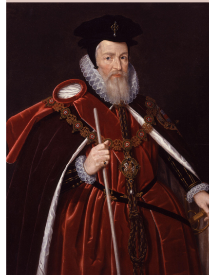
Lord William Cecil (1520–1572), neznan avtor, olje na platnu. (Hrani: National Portrait Gallery, London. Vir: https://www.flickr.com/photos/60861613@N00/3700351063/ .)

»V Elizabetini notranji politiki lahko ločimo dve obdobji. V prvih dvanajstih letih rimskih katoličanov, dasiravno je samo Molitvenik vseboval obrede, ki jih je dopuščal zakon, niso preganjali ter so jim nalagali samo zmerne globe, pa še te neredno izterjevali. V tem obdobju ni bil zaradi vere nihče usmrčen in oblasti so rade zatisnile oko spričo kaj pogostih zasebnih katoliških obredov, in to celo, če je šlo za osebe, ki so bile v visokih državnih službah. Ko pa je leta 1570 papež kraljico izobčil, njene podložnike pa odvezal od dolžnosti zvestobe, se je začelo drugo obdobje in v njem je kmalu zavela ostrejša sapa. Tuji jezuiti so križarili po otoku, se preoblečeni tihotapili od dvorca do dvorca, se skrivali v 'farških luknjah' za kakim skednjem in vcepljali mirnim angleškim katoličanom starega kova novo gorečnost evropske protireformacije. /.../ Jezuiti so sicer imeli versko nalogo, toda če bi jo bili uspešno izvedli, bi se bila v političnem pogledu končala z odstavitvijo kraljice