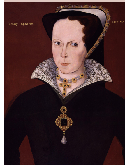
Kraljica Marija I. (1516–1558), kraljica Anglije in Irske, neznan avtor, olje na platnu.

»Marija I. (hči Henrika VIII. in Katarine Aragonske (op. N. G.)) je kot zapuščeno dekle potihem tuhtala o krivici, ki jo je doživela njena mati, in o njeni veri, to pa ni moglo razširiti ozkih meja njenega razuma; španska domovina njene matere pa je njena čustva usodno priklepala na Južno Evropo. Nobenega narodnega ponosa ni čutila v zvezi z deželo, ki ji je vladala. Skrbele so jo samo duše Angležev in prepričana je bila, da bodo varnejše v italijanskih in španskih rokah. Iz svoje kapele prav tako ni mogla spoznati resnične Anglije, kot je ni mogel njen brat (Edvard VI., sin Henrika VIII. iz tretjega zakona, op. N. G.) s svoje bolniške postelje. Brat in sestra sta bila oba tako zatopljena v proučevanje cerkvenih naukov, in v versko zamaknjenje, da nista imela občutka za širokopotezno tudorsko politiko in nista videla prostranih angleških polj in pašnikov, živahnih trgov in graščin, angleških ladij, ki so se zibale na daljnih morjih; /.../. Marija bi se bila ljudem lahko prikupila, ko bi se bila previdno vrnila k verskemu kompromisu svojega očeta, uvedla spet latinsko mašo in dala po tihem sežgati kak ducat protestantov na leto /.../. Ker pa je po vsej sili hotela vzeti Filipa Španskega za moža in se ni prav nič ozirala na želje svojih podanikov, ko je napravila iz Anglije čolniček, privezan na krmo mogočne španske galeje, ko je vztrajno zahtevala, da je treba v Angliji spet uvesti papeško sodstvo /.../ je kar dvakrat tako prizadela angleški