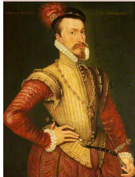
Robert Dudley, lord Leicester (1532–1588), angleško-nizozemska šola.

(Hrani: National Trust, Montacute House.)