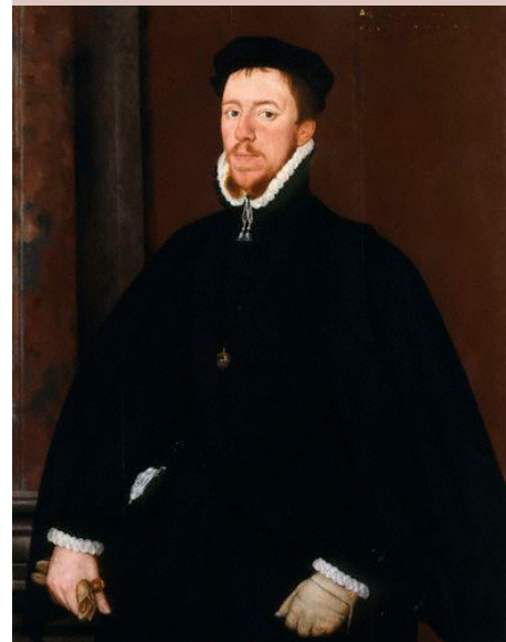
Thomas Howard, četrti vojvoda Norfolkški (1536–1572), neznani avtor, olje na platnu.

Elizabeta je biografski dramski film, ki ga je režiral Shekhar Kapur. Scenarij je napisal Michael Hirst. V glavni vlogi je Cate Blanchett kot Elizabeta I. Angleška. V stranskih vlogah so Joseph Fiennes kot Robert Dudley, Christopher Eccleston kot Norfolk, Geoffrey Rush kot sir Francis Walsingham, John Gielgud kot papež in Richard Attenborough kot sir William Cecil. Film je 8. septembra 1998 izdal studio PolyGram Filmed Entertainment. Govori o obdobju po smrti Elizabetine polsestre Marije I., ko Elizabeta postane kraljica in se mora soočiti z grožnjo Papeške države, izdajalskih plemičev ter pohlepnihih sosednjih držav.