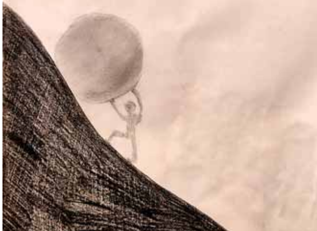
Raziskovanje antičnih metafor. (Avtorica: Lana Arabadžić.)

Sizif je bil grški mitološki kralj in ustanovitelj mesta Korin. Bil je sin Boga Eola. Imel je dostop do mize bogov, a je to čast zlorabil in izdajal ljudem skrivnosti bogov. Zato je bil kaznovan tako, da je moral valiti ogromno skalo na vrh gore, a ko jo je hotel prevaliti na drugo stran, se je vedno skotalila nazaj do vznožja gore in moral je začeti znova. To njegovo mučenje je postalo prispevka za brezuspešno, utrudljivo, neuresničljivo delo.