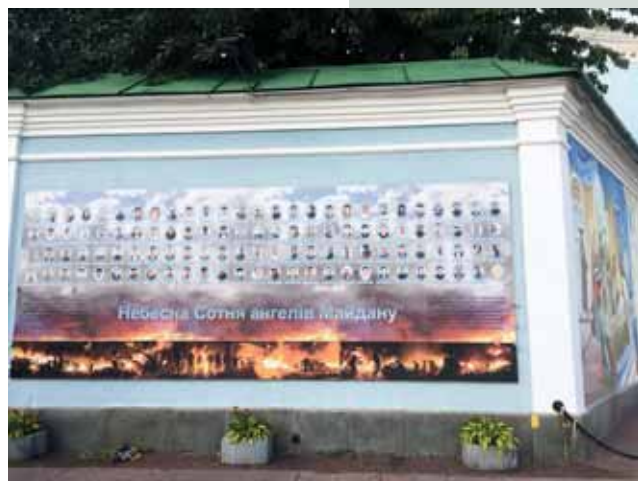
Foto 3: 'Nebeških sto' – ljudje, ki so izgubili življenje med evromajdansko revolucijo.