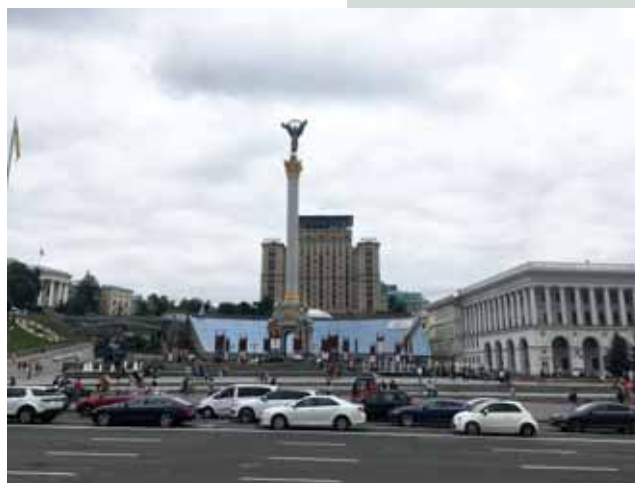
Foto 4: Trg Majdan, središče prestolnice Kiiv. (Avtor: Klemen Pucko, avgust 2019.)