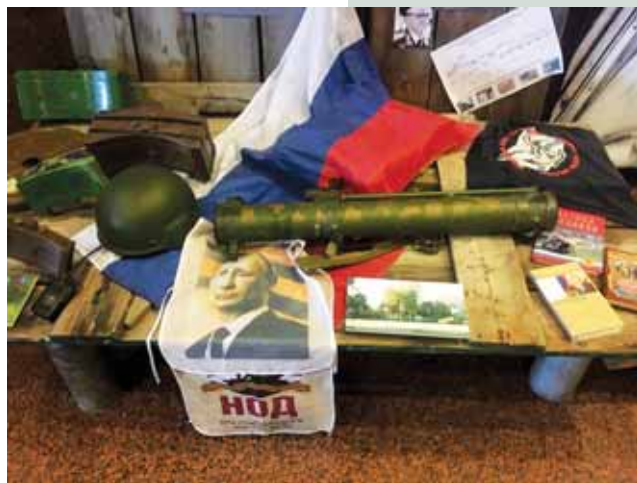
Foto 1: Vojaški muzej v Kiivu. Zbirka predmetov z vzhodnega bojišča.

Primerjava odnosov med narodom kot med velikim in malim bratom sicer izvira iz časa 17. in 18. stoletja, ko se je Ukrajince označevalo za Maloruse , območje Ukrajine pa kot Malo Rusijo . Z Veliko Rusijo se je označevalo bolj oddaljene predele, torej današnjo Rusijo. Sredi 19. stoletja je ruski imperij temeljil na skupnosti, zvezi Velikih Rusov (Rusov), Malih Rusov (Ukrajincev) in Belorusov. Bili bi naj člani skupne družine . Odhod enega