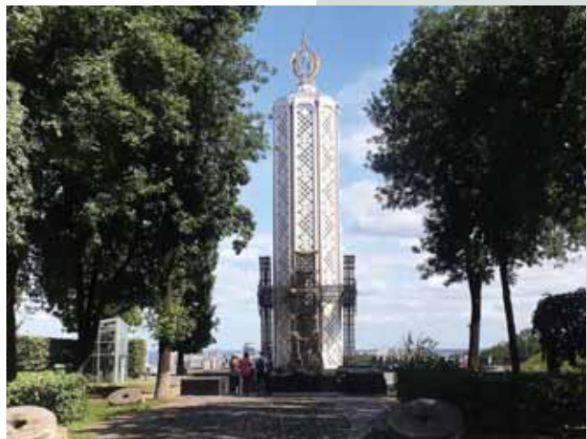
Foto 2: Muzej žrtvam holodomora v Kiivu. (Avtor: Klemen Pucko, avgust 2019.)