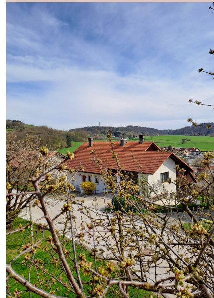
Pogled z domačega balkona proti Medvedjeku.