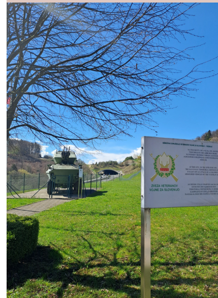
Bojno oklepno vozilo z oznako 3 (BOV 3), ki je sodelovalo v oboroženih spopadih na Medvedjeku.

Zelena drevo, polno češenj, stoji na rahlem hribu blizu Šentjurja. Deklica sedi na njem in zoba sladke sadeže, ki pa nimajo tako dobrega okusa kot po navadi. Morda