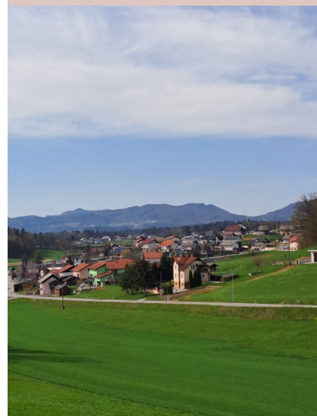
Pogled iz Medvedjaka proti Velikem Gabru