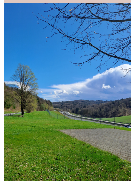
Pogled od spominskega parka proti današnji avtocesti Ljubljana–Novo mesto.