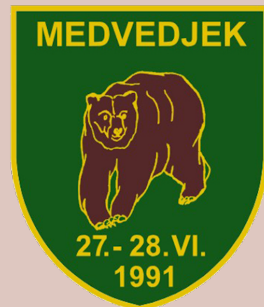
Simbolni bojni znak Medvedjek.