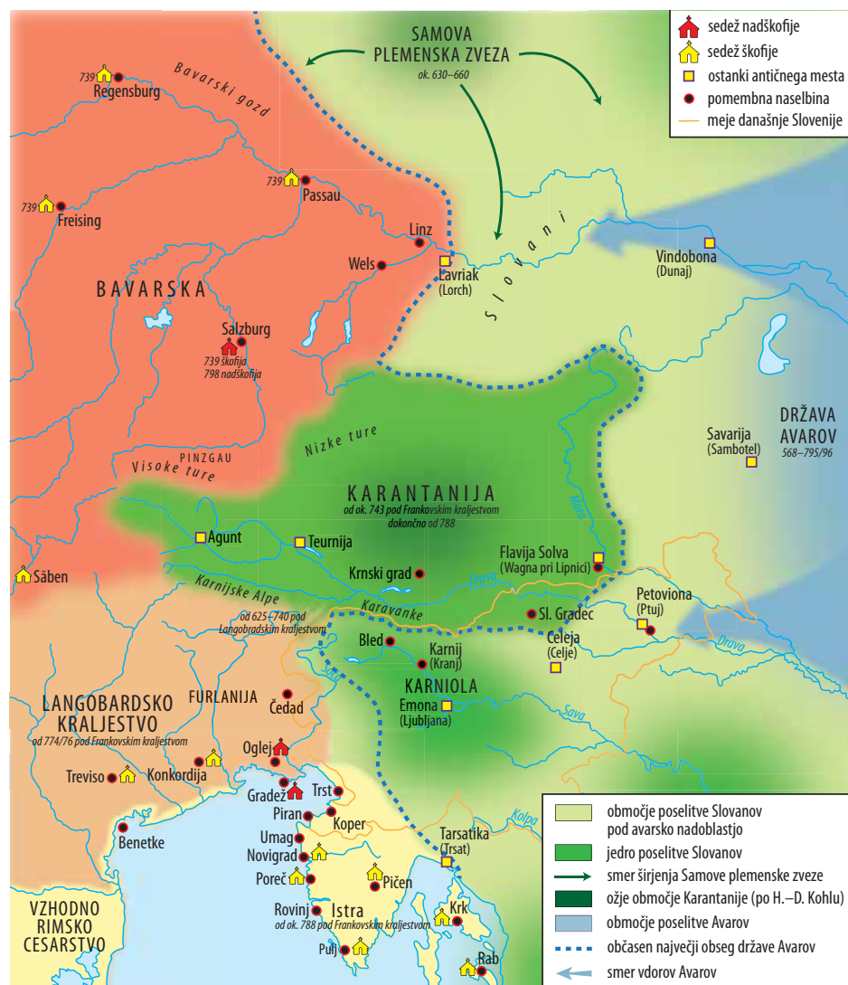
Zemljevid 2: Alpski Slovani v 7. in 8. stoletju.

Po Samovi smrti so Avari hitro obnovili svojo oblast nad večjim delom Slovanov. Izjemo je očitno predstavljal prostor severno od Karavank, o čemer pa nam viri spet govorijo samo posredno. Če Slovani v Alpah ne bi bili neodvisni od Avarov, se verjetno ne bi leta 662 k njim pred Langobardi in Avari zatekel uporni Langobard Arnefrit, o čemer poroča že omenjeni Pavel Diakon. Še bolj pa v prid njihovi neodvisnosti govori kasnejši zgodovinski razvoj.