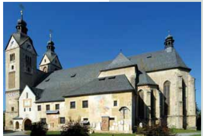
Slika 4: Cerkev Gospe Svete na Gosposvetskem polju. Gosposvetsko polje je bilo politični in cerkveni center Karantanije.