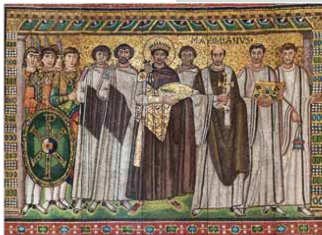
Slika 1: Cesar Justinijan I. s člani dvora, mozaik iz bazilike San Vitale v Raveni. Justinijan I. je bil zadnji vzhodnorimski cesar, ki mu je vsaj deloma uspelo obnoviti veliko rimsko cesarstvo. Vladal je med leti 527–565.

Nekaj desetletij za prvim zahodnim valom je z jugovzhoda prišel v Vzhodne Alpe še drugi slovanski val. Za razliko od prvega je bil ta povezan z Avari. Zdi se, da je prihod Slovanov svoj vrhunec dosegel v zadnjih dveh desetletjih 6. stoletja. Razpadanje pozno- antične cerkvene mreže nakazuje, da je v slovansko-avarske roke do okrog leta 588 pa- dlo Zgornje Posavje, do leta 591 pa tudi Zgornje Podravje. Do okrog 600 so Slovani prek Postojnskih vrat prodrli do naravne meje, ki jo predstavlja kraški rob, kjer se Kras začne ostro spuščati v tržaško in buzetsko zaledje. Proti Furlaniji se je meja ustalila šele v začetku 8. stoletja, ko so po spopadih s sosednjimi Langobardi Slovani poselili gričevnato ozemlje onstran Soče vse do roba Furlanske nižine. Z načrtno frankovsko kolonizacijo je bilo konec 8. stoletja s Slovani poseljeno še zaledje istrskih mest (pre- gledno Štih, Simoniti, Vodopivec, 2016).