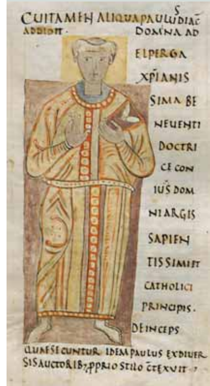
Slika 2: Pavel Diakon. Langobard Pavel Diakon je več let preživel na dvoru Karla Velikega. Njegova Zgodovina Langobardov je eden redkih virov za zgodovino vzhodnoalpskega prostora.