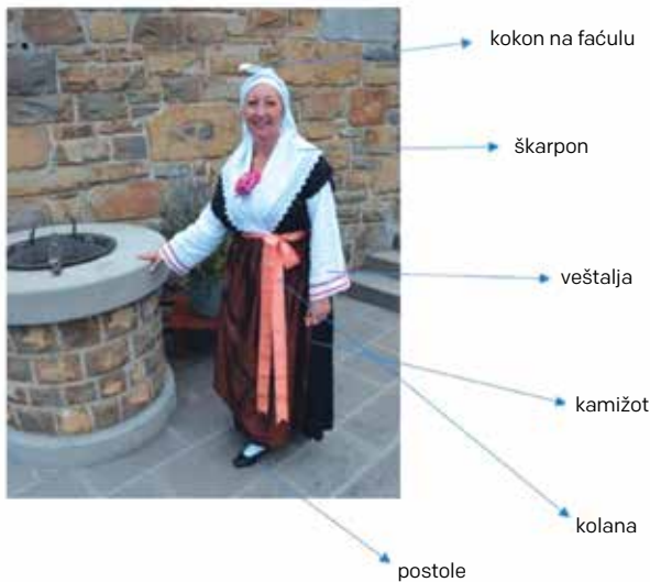
Slika 5: Izsek iz učnega lista za učence.

2011; Učni načrt, Slovenščina, 2018; Učni načrt, Likovna umetnost, 2011).