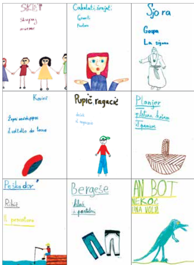
Slika 4: Nekaj strani iz slovarja.

Cilji: Učenci in učenke znajo opisati nekaj naravnih, družbenih in kulturnih značilnosti domače pokrajine; tvorijo besedilno vrstno ustrezno, smiselno in razumljivo besedilo; uporabijo v likovni nalogi primerne načine linearnega izražanja (Učni načrt, Družba,