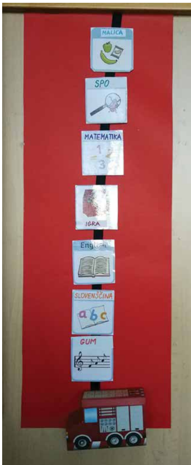
Slika 1: Urnik.

Urnik je imel samolepilni ježek, na katerega je deček vsak dan, ko je vstopil v razred, nalepil sličice predmetov, ki so bili tisti dan na urniku. Vsako uro posebej je sličico s predmetom odstranil, da je videl, koliko predmetov ga ta dan še čaka.