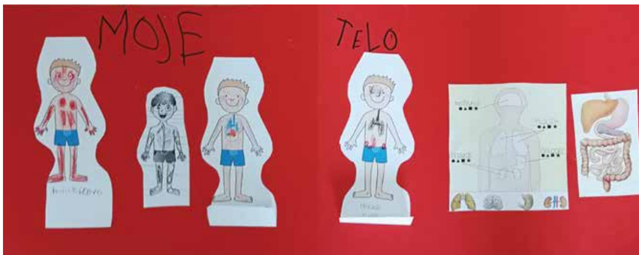
Slika 3: Plakat pri spoznavanju okolja.

Pri odštevanju si je pomagal podobno, le da je kroglice odšteval.