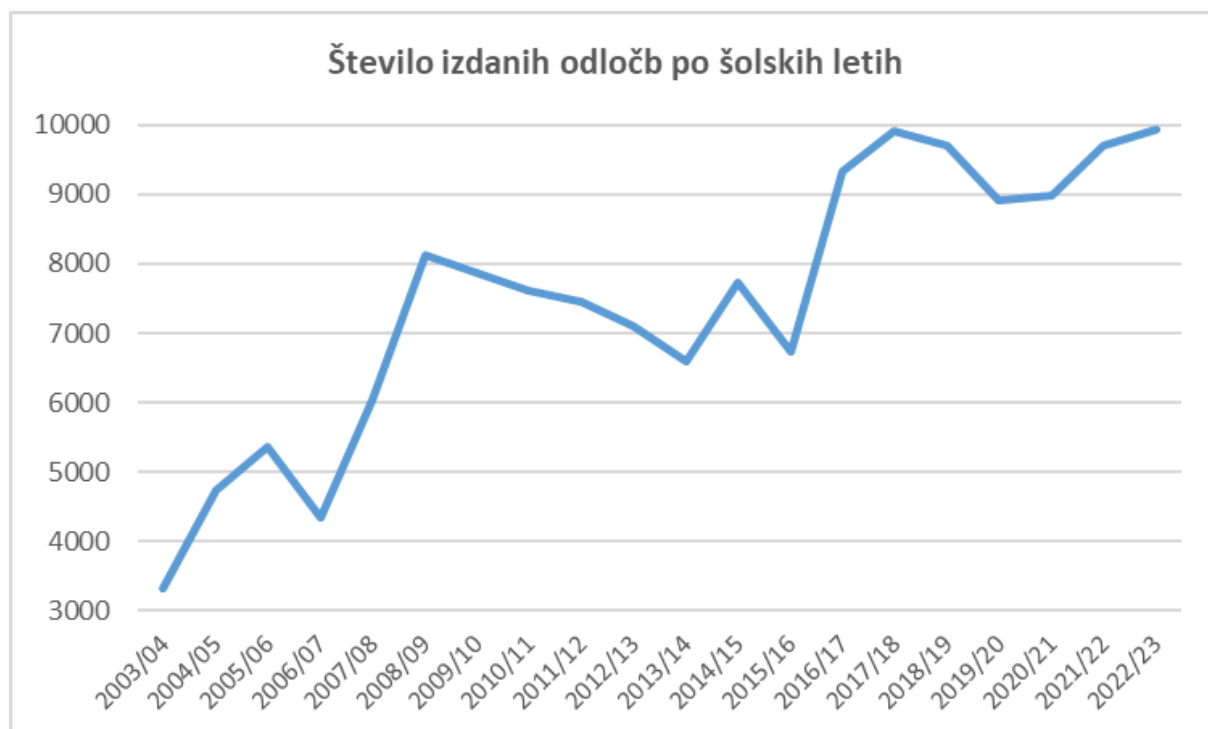
Graf:1: Porast števila odločb od leta 2003 do 2023

Podatki v grafu 1 prikazujejo porast števila izdanih odločb po šolskih letih, in sicer vse od šolskega leta 2003/2004 dalje. Upoštevane so vse vrste izdanih odločb (odločbe o usmeritvi, odločbe o neusmeritvi,časne odločbe ...). Iz grafa 1 je razvidno, da je dinamika izdajanja odločb po šolskih letih precej spremenljiva – posameznim obdobjem strme rasti sledi rahlo zmanjševanje števila izdanih odločb –, sicer pa je splošni trend za celotno analizirano obdobje naraščanje števila izdanih odločb. V analiziranem obdobju se je tako število izdanih odločb v enem šolskem letu potrojilo.