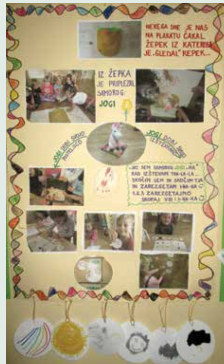
Slika 14: Dokumentiran plakat.

Fotografije plakatov, podobnih kot sta na sliki, se v portfolio odloži na list A4 formata. Tako je dokumentirana vsebina plakata otroku bolj vidna. Plakati imajo doprinos otroku zaradi procesa nastajanja in celostnega uvida v posamezen vsebinski sklop, vzporednih refleksij ter zaradi vloženega dela otroka in vrstnikov, ki so ga soustvarjali.