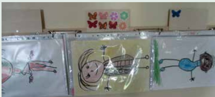
Slika 17: Portfolio na dosegu otrokom.

Dokumentiranje je »vidno« vsem in predstavlja spodbudo za ustvarjanje, bogatenje dokazov o učenju in napredku otroka ter spodbuja medvrstniško vrednotenje in samovrednotenje.