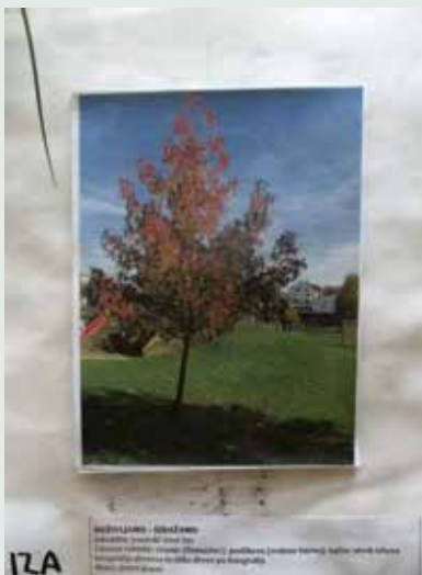
Slika 1: Doživljam.