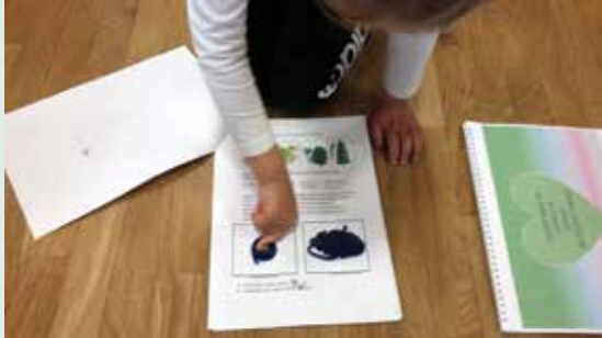
Slika 6: Predstavitev vsebine vrstnikom.

Vzgojiteljica je portfolio dobro izkoristila za krepitev medvrstniških vezi in pri individualni podpori. Dekličini dosežki so postali vidni tudi vrstnikom, čez čas je svoje dosežke rada delila v krogu z vsemi vrstniki. Preko pogovorov ob dokumentaciji portfolia z vzgojiteljico in vrstniki je dobivala veliko priložnosti za potrditve. V času zaprtja vrtca je mamica deklice I. vzgojiteljici preko e-pošte sporočila, da je deklico en dan našla na vrhu tobogana, kako objokana strmi proti kraju, kjer je vrtec. Vprašala jo je, zakaj je žalostna, in deklica ji je povedala, da pogreša prijatelje iz vrtca. Vzgojiteljica je tako dobila potrditev, da je deklica vrstnike povsem sprejela.