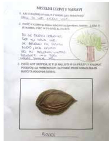
Slika 16: Miselni izzivi v naravi.

spremljanje in raziskovanje skupaj s starejšimi vrstniki in vzgojiteljicama prišla do ugotovitve, kako se drevo hrani, kar je dokazovalo napredek (v mejah individualnih zmožnosti razumevanja tega podatka) pri posameznem otroku. Otroci so osvojili tudi mnoge druge značilnosti drevesa. Večina otrok je spontano izbrala svojemu drevesu tudi ime. Prav tako pa so se seznanili in si mnogi zapomnili poimenovanje vrste drevesa, ki ga opazujejo sami ali njihovi vrstniki.