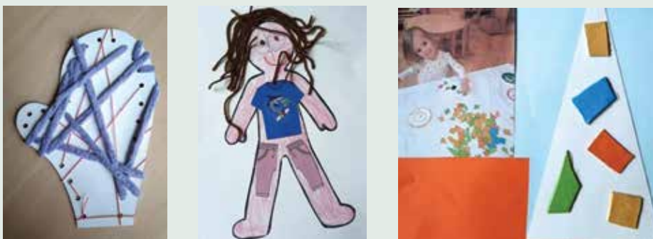
Slike 9, 10 in 11: Dokumentirani dosežki likovnega ustvarjanja 4-letne deklice.

Sliki 7 in 8 prikazujeta napredek v upodobitvi sebe v razdobju treh mesecev. Slika levo prikazuje izdelek iz meseca marca, slika desno pa likovni izdelek iz meseca junija.