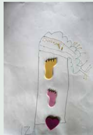
Slika 3: Stopinje na drevesu.

Slika 1 prikazuje upodobitev motiva drevesa z igrišča v jesenskem času. Slika 2 prikazuje opremljenost likovnega izdelka na hrbtni strani. Barviti listi so bili deklici dokumentiranega izdelka spodbuda za likovno izražane z mokrimi barvami (otrok je lahko izbiral med suhimi barvicami, flomastri, voščenkami, svinčnikom in