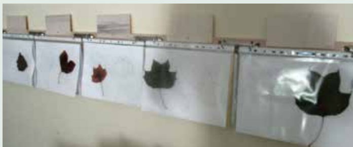
Slika 18: Portfolio na dosegu otrokom.

Dokumentiranje je »vidno« vsem in predstavlja spodbudo za ustvarjanje, bogatenje dokazov o učenju in napredku otroka ter spodbuja medvrstniško vrednotenje in samovrednotenje.