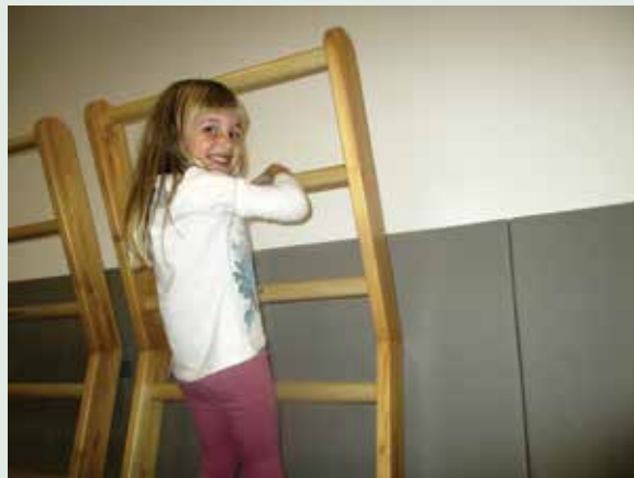
Sliki 12 in 13: Dokumentiran medvrstniški dosežek pri igri z nestrukturiranim materialom ter deklice, ki se ji je prvič uspelo povzpeti do vrha lestve v telovadnici.