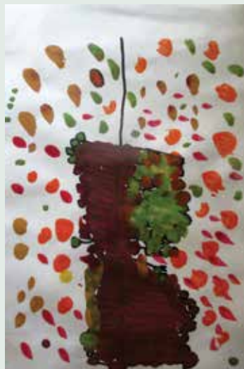
Slika 2: Izražam.