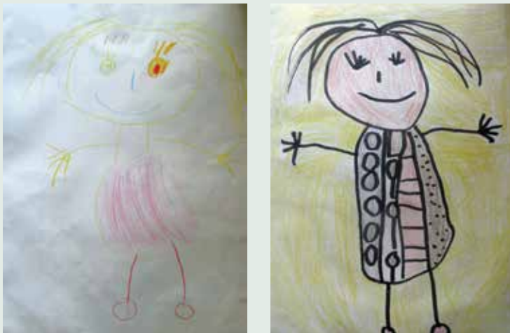
Sliki 7 in 8: Napredek v likovnem izražanju.

Sliki 7 in 8 prikazujeta napredek v upodobitvi sebe v razdobju treh mesecev. Slika levo prikazuje izdelek iz meseca marca, slika desno pa likovni izdelek iz meseca junija.