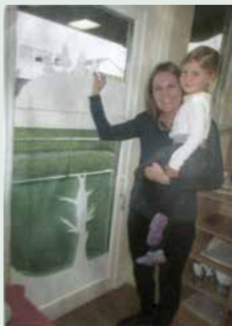
Sliki 4 in 5: Dokumentiranje dogodkov.

Slika 4 prikazuje dokumentirani izdelek, ki ga je otrok izdelal skupaj s starši. Dodan je utrinek z delavnice, kjer so starši z otrokom. Slika 5 prikazuje utrinek s predstave s senčnim gledališčem. Dokumentacija, na kateri so fotografije sodelovanja s starši, imajo za otroke dodano vrednost. Ob fotografijah dogodkov v portfoliu se otroci še posebej radi ustavljajo in dogodke podoživljajo.