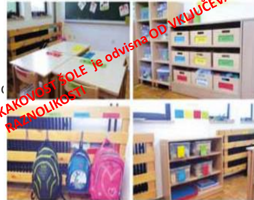
Grubar M.2021, slika: Organizacija učnega prostora z uporabo barvnih oznak.