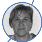
Cvetka Rutar Osnovna šola Preserje