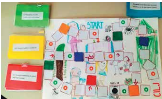
▶ SLIKA 6: Družabna igra

Na predlog otrok smo izdelali družabno igro.