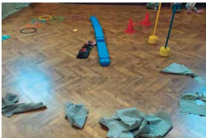
▶ SLIKA 5: Šivilja in škarjice. Krpe predstavljajo blago, ki so ga škarjice razrezale grajski gospe.

kazalo, kako so ustvarjalni, iznajdljivi in kako posamezne vsebine povezujejo.