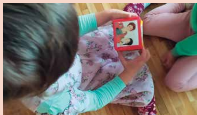
► SLIKA 4: Pravljična kocka

Otroci so na začetku povedali samo naslov, kasneje pa so svoje pripovedovanje nadgradili.