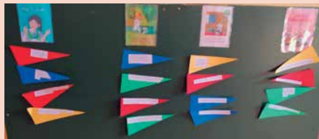
► SLIKA 1: Razvrščanje povedi

Gradniki: širjenje besedišča, razumevanje koncepta bralnega gradiva