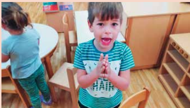
► SLIKA 2: Členjene besede

Pri tej dejavnosti so otroci iz vrečke izvlekli sličico, ki je bila vsebinsko povezana s pravljičicami, ki smo jih brali. Sličico so poimenovali, nato so členili besedo na zloge in jo razvrstili glede na število zlogov (1, 2 ali 3 zloge). Vsak je poiskal pot, ki ga je z gibanjem pripeljala do cilja oz. do kroga z ustreznim številom pik (slika). Tu je bil poudarek na medpodročnem povezovanju: jezik, matematika, gibanje.