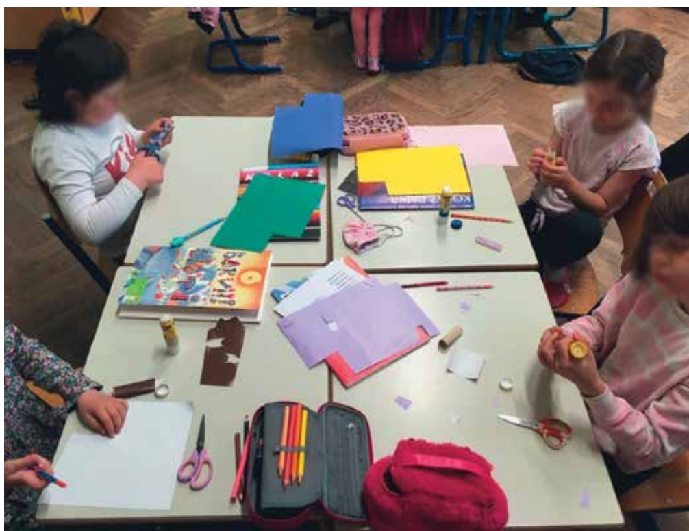
► SLIKA 3: Izdelovanje lutk

Učenci so imeli možnost povedati, kar so želeli. Poročali so, da jim je bilo najbolj všeč, ko smo skupaj ustvarili drevo želja.