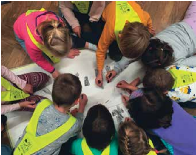
► SLIKA 1: Ustvarjanje scene za zgodbo

Kulturni dan je bil zaznamovan z zgodbami afriškega izvora o iznajdljivem pajku Anansiju. Katja je učencem pripovedovala tri zgodbe o njem. Med vsako je bil premor, v katerem je z učenci izvedla poustvarjalno dejavnost. Po zaključnem pripovedovanju so učenci najprej ustvarili sceno za vsako zgodbo. Sledilo je še samostojno izdelovanje naprstnih lutk. Ko so učenci končali, jih je umetnica z lutko povabila v spontano igro, prek katere so zaigrali zgodbo, ki so jo poslušali. Zatem jim je zastavila vprašanje: »O čem misliš, da bi se med seboj pogovarjale živali iz zgodbe?« S tem jih je spodbudila, da so stopili v interakcijo z drugo lutko in odigrali domišljjski dialog. Za konec so skupaj z umetnico določili še Orffovo glasbilo, ki bi predstavljalo določeno žival iz zgodbe. Sledilo je še nekaj improvizacije z glasbili in lutkami.