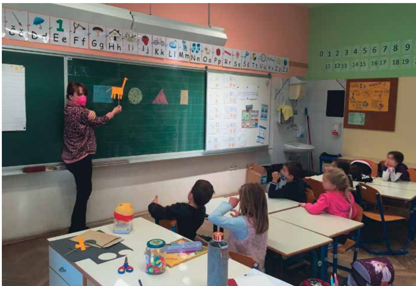
► SLIKA 2: Pri uri slovenščine

Učenci so imeli možnost povedati, kar so želeli. Poročali so, da jim je bilo najbolj všeč, ko smo skupaj ustvarili drevo želja.