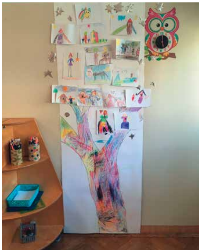
► SLIKA 4: Drevo življenja