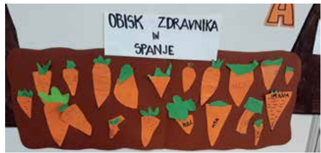
Slika 3: Gredica korenja.

Z vzgojiteljico sva zaigrali nekaj socialnih prizorov, ki se dogajajo med učencema. Uprizorili sva situacijo, ko učenca: