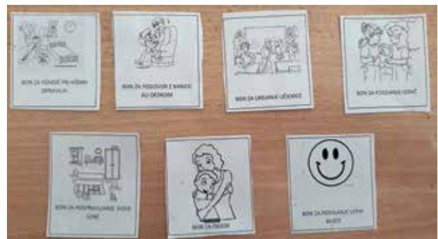
Slika 4: Boni za prijazne odnose

Prijazne odnose so udeleženi tako, da so vsak dan izžrebali bon z nalogo in ga nalepili v zvezek. Ko so napisano in narisano nalogo opravili, so bon v zvezku pobarvali. Evalvacija je temeljila na pogovoru po opravljeni dejavnosti.