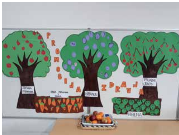
Slika 5: Izdelan Vrt dobrega počutja v projektu Promocija zdravja.

Dokončan Vrt dobrega počutja smo si z učenci ogledali, povzeli dejavnosti in naredili analizo. Učencem so bili najbolj všeč gibanje, družabna igra in kuhanje, manj urejanje učilnice in pospravljanje sobe.