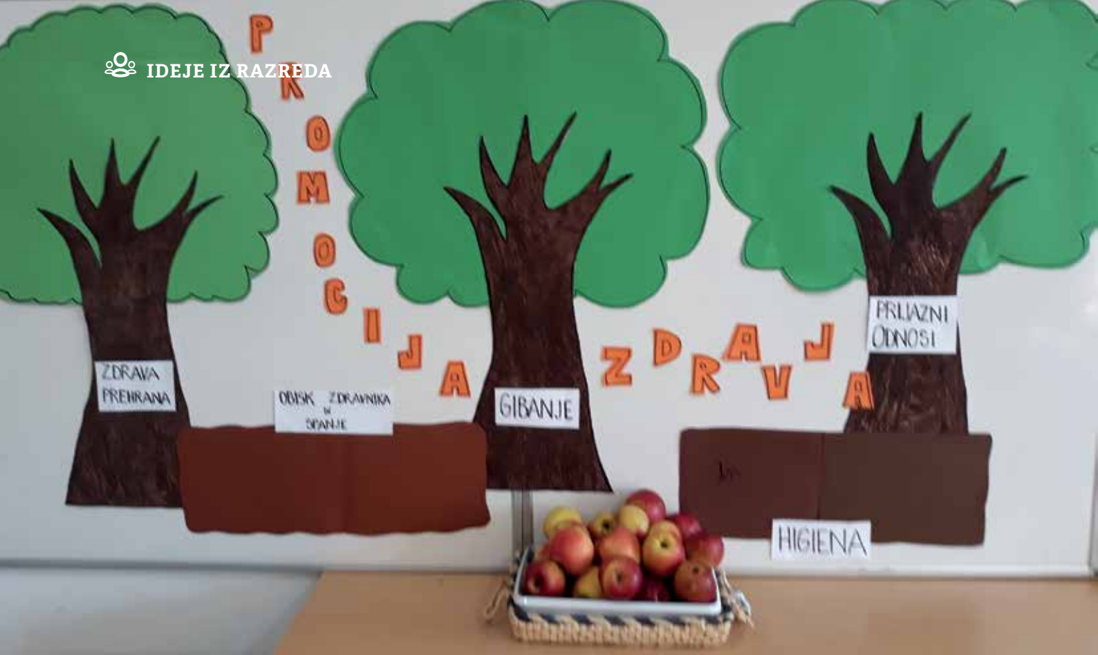
Slika 1: Vrt dobrega počutja.