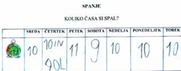
Slika 2: Beleženje ur spanja.

Učenci so svoj čas spanja teden dni beležili v preglednico. Rezultati so pokazali, da večinoma učenci spijo dovolj dolgo, povprečno od 8 do 12 ur.