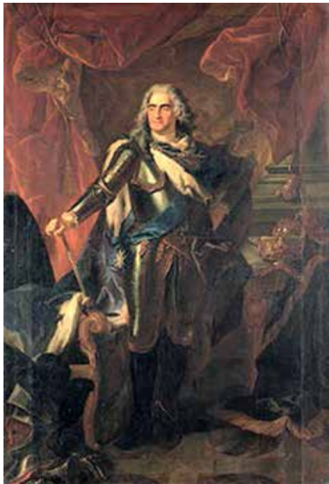
Slika 4: Friedrich August II. von Sachsen, imenovan Avgust Močni.

Vsaka skupina predstavi svoj opis in domneve, učencem pustimo prosto pot in domišljijo. Izbrani član skupine predstavi opis, ki so ga sestavili. Ob tem pa učitelj predstavi resnične podatke o življenju te osebe. Pri vsaki skupini predstavi del življenjepisa, kar na koncu zaokroži v smiselno celoto.