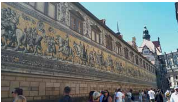
Slika 3: Furstenzug – sprevod voditeljev in kraljev dežele Saške