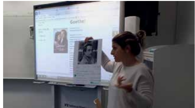
Slika 5: Predstavitve naloge po ogledu filma Goethe!

Učitelj ob koncu predstavitve pove naslov pesmi, pokaže fotografijo pesnika/pesnice in pove nekaj bistvenih podatkov iz življenjepisa.