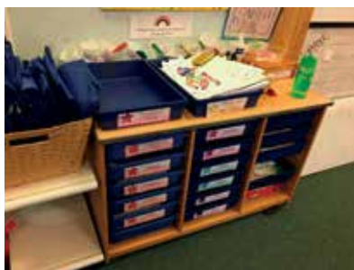
Slika 11: Police za organizacijo dela

V vsakem razredu osnovne šole je polica, v kateri imajo učenci predale. Vanje vlagajo rešene in pregledane delovne liste. Na vrhu police sta dve škatli, na eni je napis DOKONČANE NALOGE in na drugi napis DELO, KI ŠE NI KONČANO. Učenci tako pospravljajo svoje izdelke, učiteljica jih pregleda in jih vrne v škatlo dokončani izdelki. Le-te učenci potem uvrstijo v svoje škatle.