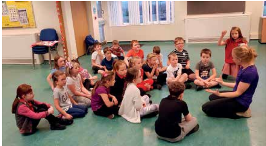
Sliki 13 in 14: Kriteriji uspešnosti v telovadnici