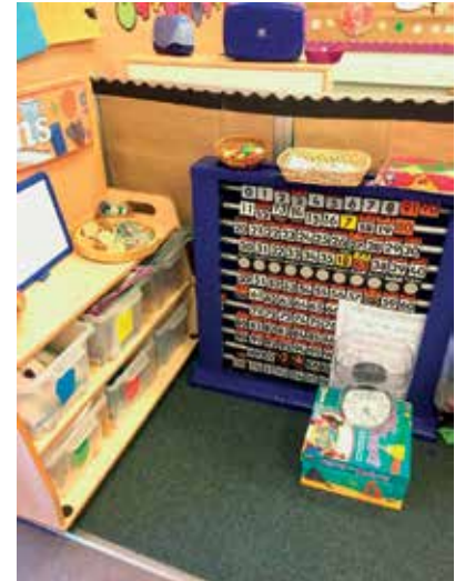
Slika 7: Matematični kotiček

telesa, številске kocke. Ob vseh aktivnostih je naveden namen učenja.