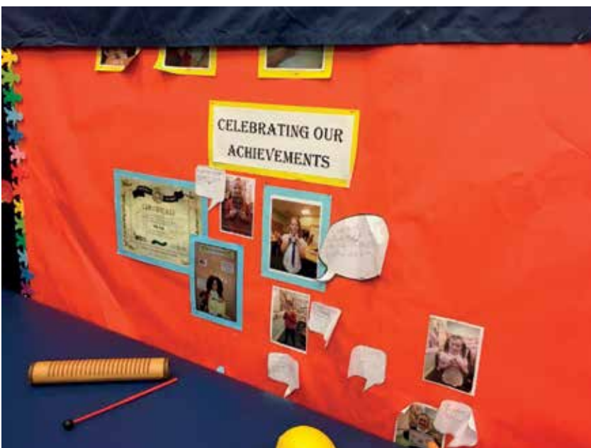
Slika 17: Praznovanje naših dosežkov

vseh dejavnosti šole. Tako smo lahko opazili vključenost učencev v načrtovanje učnega okolja, počutja, kakor tudi v organiziranje vseh dejavnosti šole. Pomembno vlogo ima tudi povratna informacija. V omenjeni šoli posebno mesto zavzema igra in veščine, ki jih otroci preko nje lahko razvijajo. Mnogo drugih idej pa ob naslednji priložnosti.