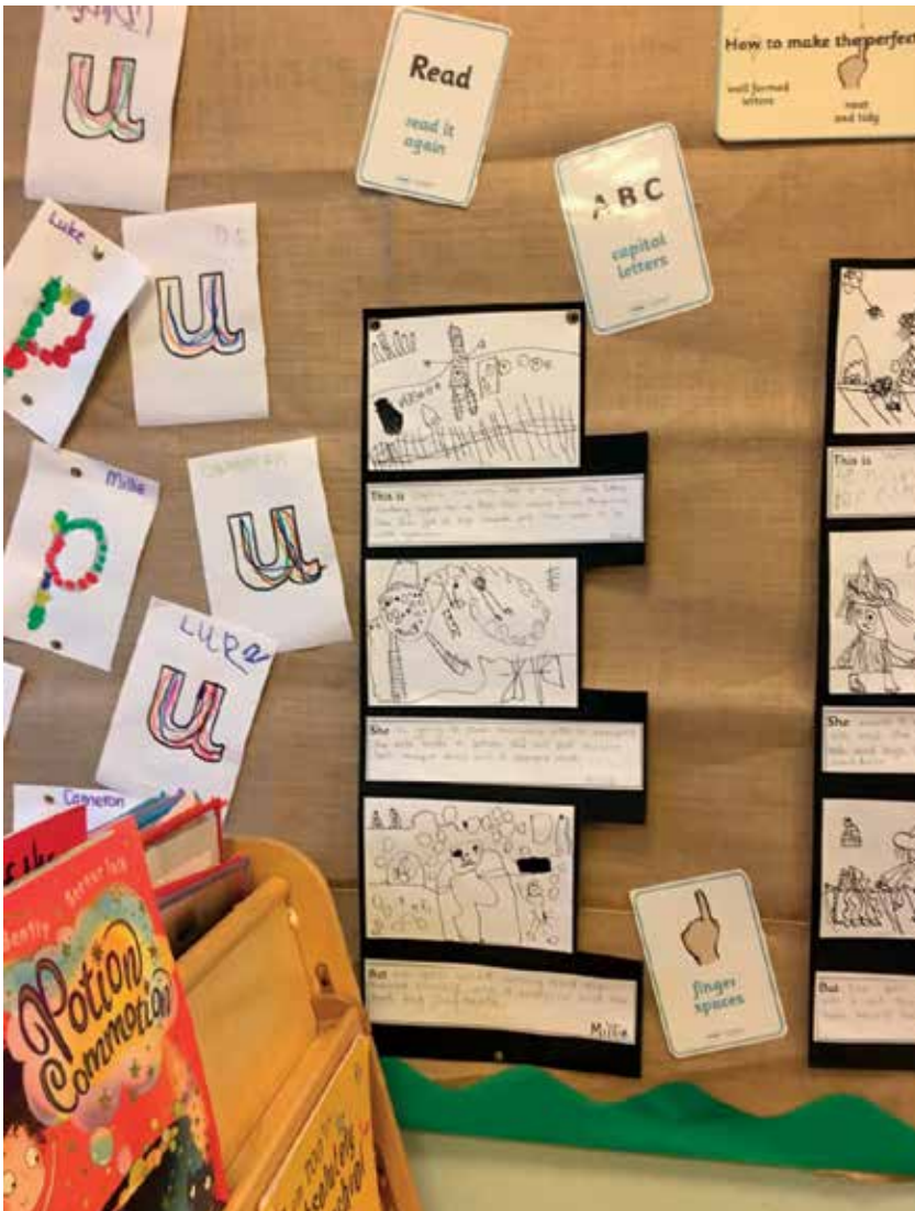
Slika 5: Kotiček za pisanje

teh stopnicah pogosto opravljajo skupinske pogovore ali delo v dvojicah.