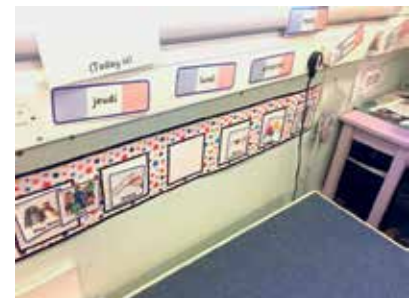
Slika 4: Dnevni načrt dela v razredu

V prvem razredu je pod glavno tablo nameščen časovni trak, na katerem učiteljica z učenci vsak dan na začetku dneva prikaže potek dela. V ta namen imajo v razredu pripravljene kartončke s sliko in opisom dejavnosti, npr. pisanje, igra, pogovor v krogu ... Te kartončke razvrstijo v ustrezen vrstni red in ob koncu dneva ob njih reflektirajo, kaj so počeli in kako uspešni so bili pri tem.