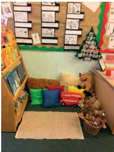
Slika 10: Bralni kotiček

V kotičku imajo posebno mesto tudi rdeči listki z naborom »zahtevnih« besed. Gre za besede, ki jih je težje prebrati ali zapisati oz. za besede, ki se drugače pišejo kot berejo ali izgovarjajo. Ob teh besedah je naveden namen učenja: »Učimo se brati in pisati »zapletene« besede.«