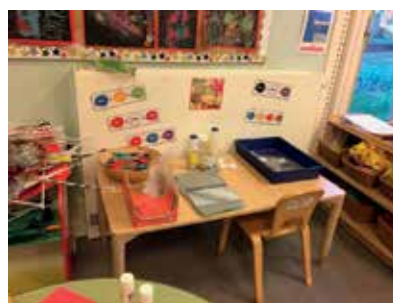
Slika 6: Likovni kotiček

V likovnem kotičku so učencem na voljo različni likovni materiali. Na tabli v kotičku je s piktogrami nakazana tudi likovna naloga oz. likovni problem. V času našega opazovanja je to bilo mešanje barv, kar učenci preizkušajo z različnimi tehnikami.