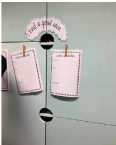
Slika 12: Zbiranje idej

Na omari so nameščeni listi, ki so namenjeni zbiranju dobrih idej za nove projekte in dejavnosti. Ko ima učenec idejo za to, kaj bi še lahko počeli ali raziskovali, to sporoči učiteljici. Učenec sam ali pa učiteljica idejo zapiše na list. Ob priložnosti razmislijo o uresničitvi ideje in o načinu, kako jo izvesti.