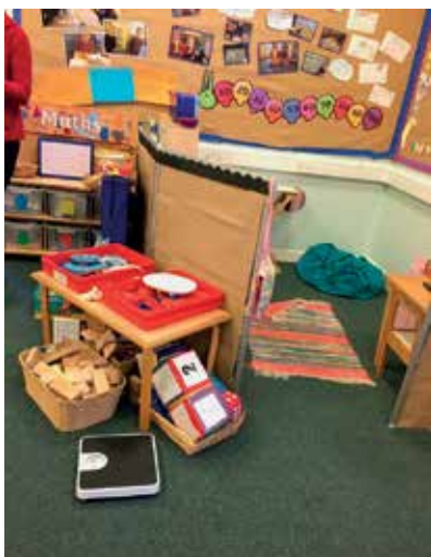
Slika 9: Igralni kotiček

Kotiček za pisanje prehaja v spodnjem delu v bralni kotiček, ki je ograjen s knjižnim poličnikom in preprogo. Učenec si izbere blazino, izbere knjigo ali revijo in bere. Pri tem je pozoren na kriterije uspešnosti za tiho branje. V kotičku so raznolika bralna gradiva, od stripov, slikanic, slikopisov, leporela, do časopisov in otroških enciklopedij.