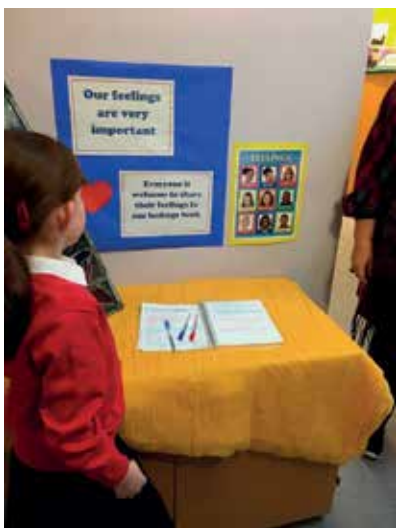
Slika 1: Naši občutki so zelo pomembni – tabla in zvezek na hodniku šole

Ob vstopu v avlo šole nas je poleg mnogih plakatov, ki izražajo vizijo šole, pričakala polička, nad katero je zapisano NAŠI OBCUTKI SO ZELO POMEMBNI . Na polici je bil nastavljen zvezek, v katerega lahko vsak učenec, delavec ali obiskovalec šole v vsakem trenutku napiše, kaj občuti oz. kako se počuti.