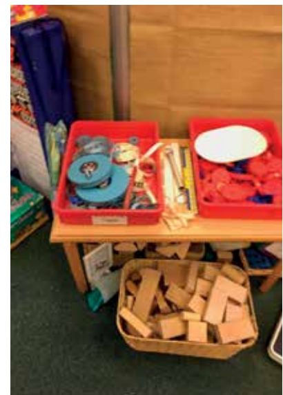
Slika 8: Matematični kotiček

V prvem razredu ima velik pomen tudi čas za igro, kar lahko prepoznamo tudi iz urejenosti prostora. S preprostim kartonom je nakazana meja za igralni kotiček, v katerem so preproga, likalna miza, igralna kuhinja, lutke, dojenčki. Učenci se lahko v vsakem trenutku umaknejo v ta kotiček. Tega ne izkoriščajo v času drugih dejavnosti, saj vedo, da bo čas za igro vsak dan tudi odmerjen. →