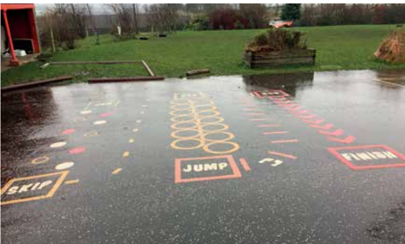
Slika 15: Šolsko dvorišče in igrišče