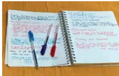
Slika 2: Zvezek, v katerega se pišejo čustva in občutki

V zvezek na hodniku vpisujejo svoje refleksije učitelji, učenci in drugi delavci šole. Eden izmed vpisov učiteljice ima naslednjo vsebino: »Ponosna sem na učenca svojega razreda, saj se danes na igrišču igrali tako, da so spoštovali drug drugega in bili drug z drugim prijazni. « (november, učiteljica M. P.)