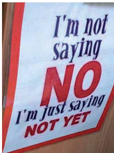
Slika 3: Pozitivne misli v vseh prostorih

Ob vходу v razrede smo lahko opazili napise: NE REČEM NE, AMPAK REČEM NE ŠE . Učenec 4. razreda nam je razložil, da se tega držijo in da namesto, da rečeš » da ne znaš «, rečeš, » da še ne znaš «, obenem pa poveš, do kdaj se boš naučil. Povedal je tudi, da to uporabljajo tudi učitelji, ko se pogovarjajo z učenci.