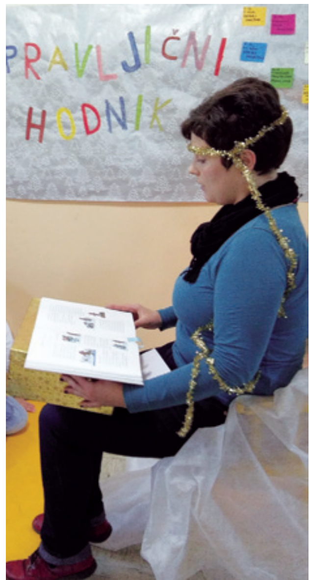
Slika 3: Pravljica