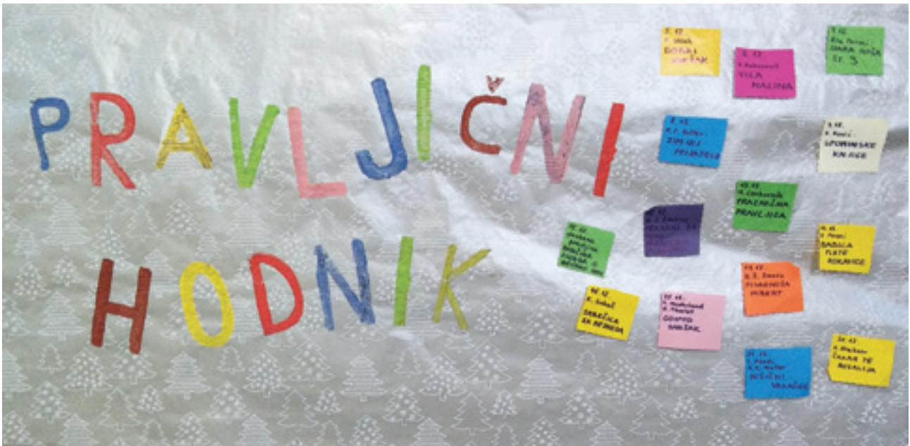
Slika 1: Scena

neznane besede, pogovarjam se z njimi o sporočilnosti besedila ter podajam ideje za likovno/glasbeno/gibalno/besedno poustvarjanje besedil. Za branje jih spodbujam z raznovrstnimi "bralnimi listi", s skupinskim branjem in s tedenskimi obiski šolske knjižnice. Ker se zavedam, da je zgled najboljši učitelj, sem dobila idejo, da bi brala na hodniku, kjer bi me vsi učenci lahko videli in slišali. Tako se je v mesecu septembru 2016 začela oblikovati ideja o Pravljičnem hodniku: branju pravljic med glavnim odmorom v mesecu decembru na hodniku prvega triletja. To je tisti del šole, kjer se učenci iz različnih oddelkov in razredov srečujejo in pogovarjajo. Učencem bi na tak način prikazala, da lahko beremo kadar koli in kjer koli. December, ki je največkrat mesec veselja in obdarovanj, je zelo primeren za tovrstno dejavnost, saj bi učencem vsak dan podarila darilo: vstop v svet pravljice. Zanimalo me je, kako se bodo učenci odzvali na ta dogodek na hodniku. Koliko učencev bo prihajalo poslušat pravljico med odmori?