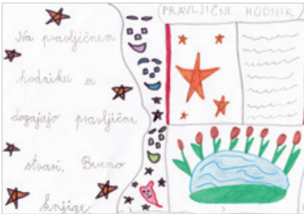
Slika 2: Izdelek učenke Mance Menart