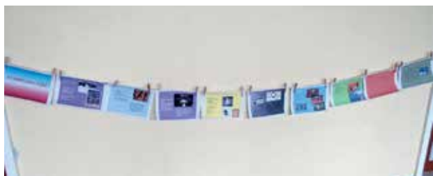
Slika 2: PowerPoint predstavitev »Olimpijske igre«.

Učence in učenci zadovoljujejo potrebe po gibanju, gibalnem izražanju in ustvarjalnosti, se sprostijo in razvedrijo. Razvijajo medsebojno sodelovanje, spoštujejo lastne in tuje dosežke, utrjujejo samozavest in pridobivajo trajne športne navade (prav tam).