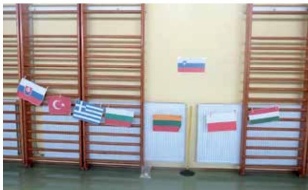
Slika 1: Zastave držav članic projekta.

V Konceptu dni dejavnosti (MIZS, 1998) so zasnovani cilji učenkam in učencem omogočiti utrjevanje in povezovanje znanja, pridobljenega pri posameznih predmetih in predmetnih področjih, uporabljanje tega znanja in njegovo nadgrajevanje s praktičnim učenjem v kontekstu medsebojnega sodelovanja in odzivanja na aktualne dogodke v ožjem in širšem družbenem okolju.