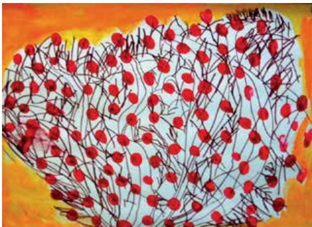
Slika 5: Šipkov grm 2 z odtisi prstov in vodenimi barvicami

In lahko ga predrugačimo, če se zavedamo, da se skozi risbo odraža otrokovo razmišljanje in čustvovanje, tudi njegovo razumevanje sveta (Jontes, 2007). Po Platonovo bi lahko rekli, da je lepo tisto, kar je dobro (in obratno). Kaj je torej dobro? To, da otrok pri risanju občuti svobodo in vznesenost nad ustvarjanjem in da je potem to potrjeno tudi s strani učitelja. Svoboda, igrivost in užitek so pomembni dejavniki pri ustvarjanju, tako odraslem kot otroškem (Kudielka, 2009). Kar ne pomeni, da otrok, ko je že sposoben ustvariti nekaj po načrtu, čečka brez cilja, šprica naokrog in packa po mili volji. Vseeno ga usmerjamo k likovni nalogi, vendar ne uničimo njegovega veselja ob nastajanju nečesa likovnega. Včasih naredimo več škode, če se vtikamo v otrokovo risanje ali slikanje, kot če mu pustimo, da zaorje v barve ali se zaplete v črte. Če vidimo, da je otrok