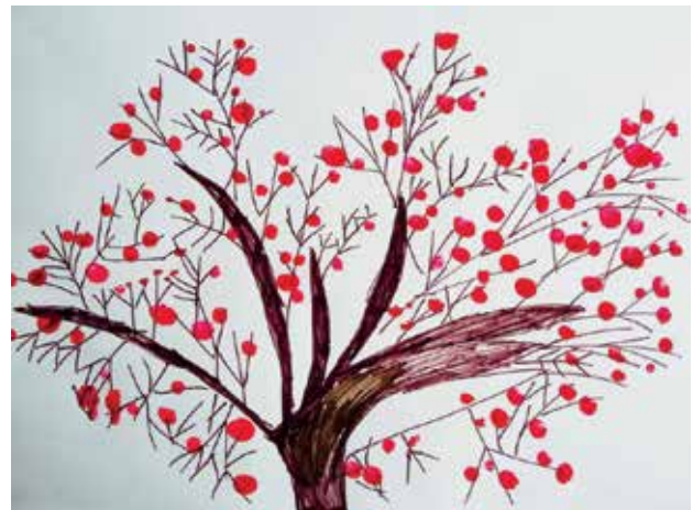
Slika 4: Šopkov grm 4, risba in odtisi s prsti