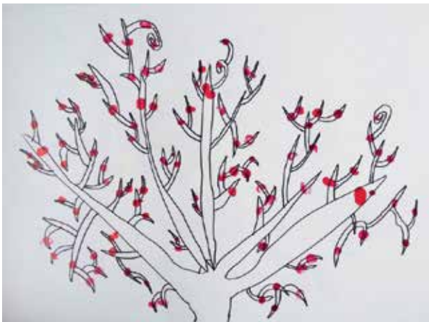
Slika 3: Šopkov grm 3, risba in odtisi s prsti