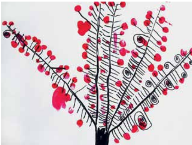
Slika 1: Šopkov grm 1, risba in odtisi s prsti

Če torej otrok samo posnema risbo odraslih, če ga pri tem popravljamo in mu vsiljujemo svoje rešitve, ga to zmede. Likovni izdelki odraslih so veliko preveč