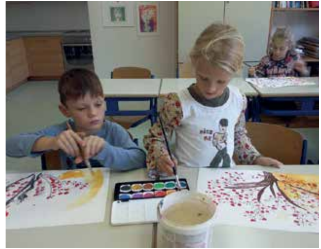
Slika 8: Slikanje z vodenimi barvami