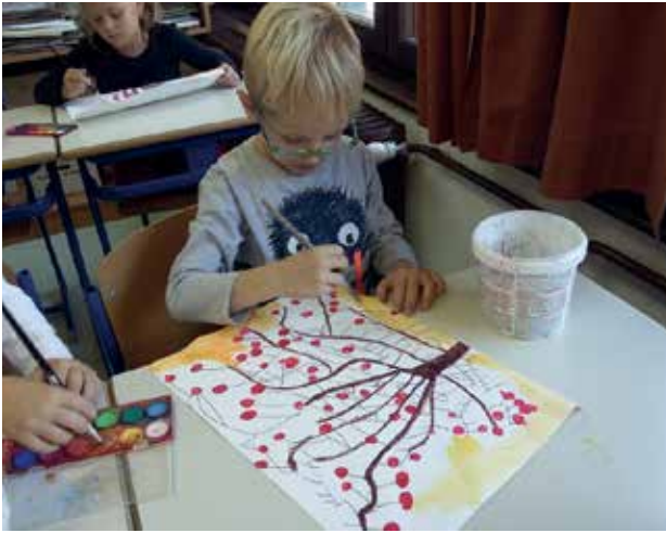
Slika 7: Slikanje ozadja