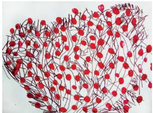
Slika 2: Šopkov grm 2, risba in odtisi s prsti