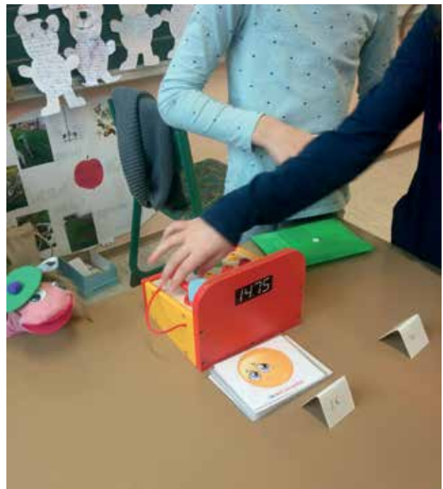
Slika 6: Prodajalna z besedami

Lutka je moj pomočnik tudi pri igranju različnih dialogov. Učencem na izbiro ponudi različne kartončke s sličicami. Učenci izberejo eno izmed sličic in z lutko zaigrajo narisano situacijo. Če učenci ne vedo, kaj bi rekli, jim lutka besedilo zašepeta na uho.