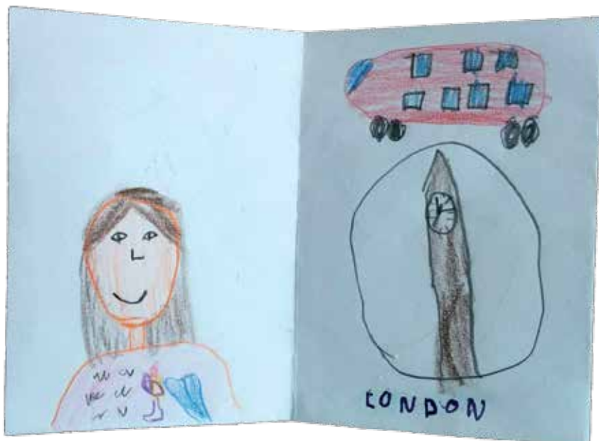
Sliki 2 in 3: Stran iz potnega lista