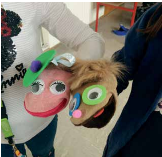
Slika 5: Lutki Jack in Lucy.

Takrat ko je Jack na počitnicah, nas obiše njegova sestra Lucy. Tudi Lucy je lutka, narejena iz nogavice. Je zelo radovedna lutka. Kadar pride v razred, zelo veliko sprašuje. Lutka Lucy je v naš razred prišla šele pred kratkim. Idejo za izdelavo mi je dala učenka. Predlagala je, da bi bilo dobro, če bi Jack imel sestrico.