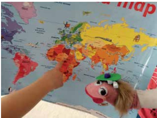
Slika 4: Iskanje krajev na zemljevidu

Takrat ko je Jack na počitnicah, nas obiše njegova sestra Lucy. Tudi Lucy je lutka, narejena iz nogavice. Je zelo radovedna lutka. Kadar pride v razred, zelo veliko sprašuje. Lutka Lucy je v naš razred prišla šele pred kratkim. Idejo za izdelavo mi je dala učenka. Predlagala je, da bi bilo dobro, če bi Jack imel sestrico.