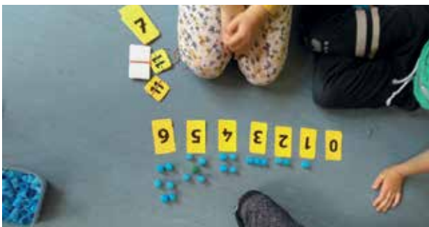
Slika 3: Delo s konkretnim materialom.