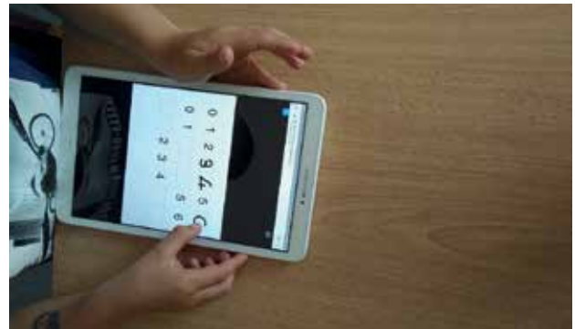
Slika 13: Urejanje števil po velikosti.

Dejavnosti v skupinah so si učenci poljubno izbirali, edini pogoj je bil, da v skupini ne smejo biti več kot štirje učenci. Učenci so presojali svoje znanje glede doseganja ciljev. Nato so sledile dejavnosti ob uporabi tablice. Pripravljene naloge so zahtevale preštevanje narisanih predmetov, zapisovanje številke na različnih mestih v učilnici (na mizi, tleh, stenah, po ogledalu ...), z različnimi pisali (svinčnik, flomastri, barvice, voščenske, ščipalke), na balone, z brivsko peno, v zdrob, na i-tablo in tablico.