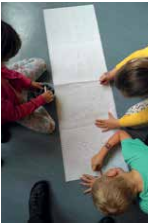
Slika 9: Zapis števila na tleh, na stenah, na ogledalo ...