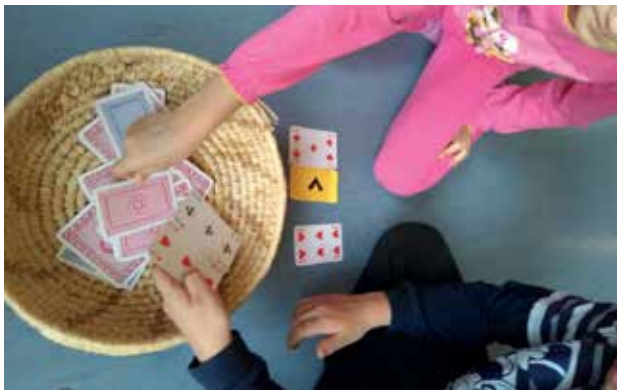
Slika 2: Primerjanje števil po velikosti.

V nadaljevanju ure so bile organizirane dejavnosti za urjenje in utrjevanje znanja.