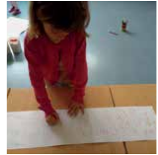
Slika 12: Zapis števila s ščipalko na podlago ...