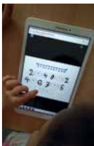
Slika 16: Določim predhodnik in naslednik danemu številu.

Učenci so sproti v učnem procesu dobivali ustne povratne informacije. Pri podajanju le-te sem bila pozorna, da je bila učencu povratna informacija razumljiva in da je bila povezana z nameni učenja in kriteriji uspešnosti, ki smo jih izdelali. Ko je učenec rešil nalogo, je najprej preveril pravilnost rešene naloge, nato pa s pomočjo kriterijev uspešnosti (in z mojo pomočjo) presojal svoje znanje. Na svojem računalniku sem lahko tudi sproti spremljala ustreznost rešenih nalog posameznikov.