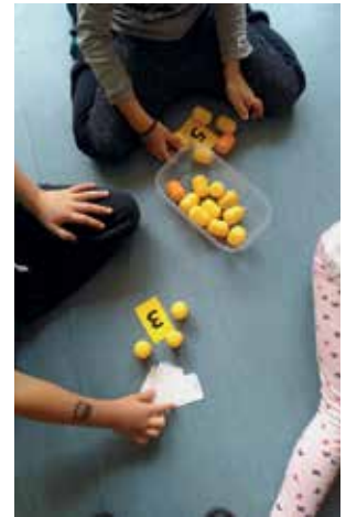
Slika 5: Štetje jajc.