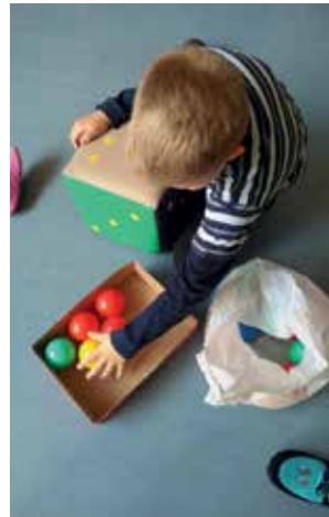
Slika 4: Preštevanje žog ali poiskati domino z ustreznim številom pik.