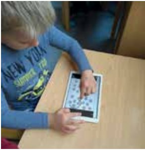
Slika 7: Preštevanje snežink na tablici.