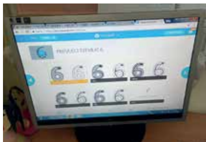
Slika 17: Dokazi na tablicah.

Ob koncu ure so učenci razmislili o svojem delu. Povedali so, kaj jim je šlo dobro, pri tem so si pomagali s kriteriji uspešnosti, ki jih imamo ves čas na tabli, kje so naleteli na težave in kako so jih odpravili, kaj bodo morali še narediti ter koga bodo prosili za pomoč.