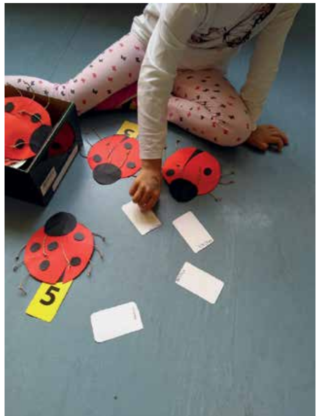
Slika 6: Preštevanje pik na pikapoloniah...