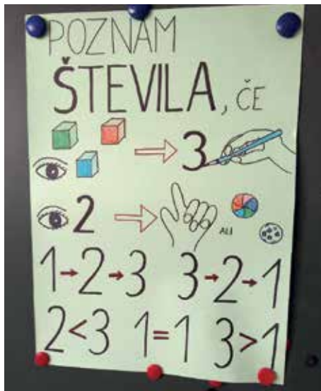
Slika 1: Kriteriji uspešnosti.

danemu številu ter števila do 5 urejati po velikosti. Moj namen je bil, da učenci sami pridejo do ugotovitve, kaj morajo še vaditi oziroma kaj bi se želeli še naučiti.