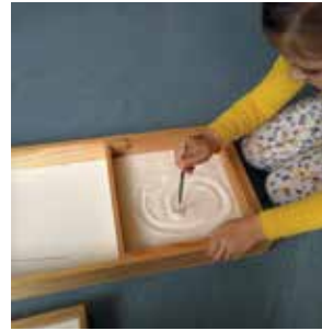
Slika 11: Zapis števila v zdrob ...