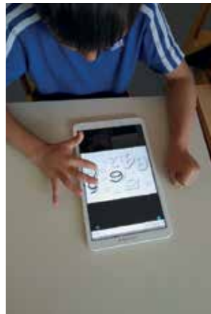
Slika 10: Zapis števila.