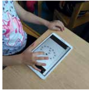
Slika 8: Zapis števila na tablico.