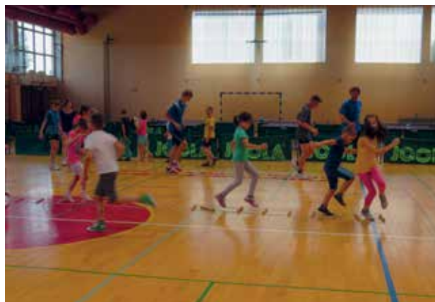
Slika 2: Športna aktivnost v sodelovanju s KNZ Murska Sobota.

Potek delavnic smo omejili na največ eno šolsko uro, potem sledijo vodene športne aktivnosti in spet bolj umirjene dejavnosti. Takšen način izvajanja dejavnosti je po naših izkušnjah najbolj primeren pristop za to starostno stopnjo učencev.