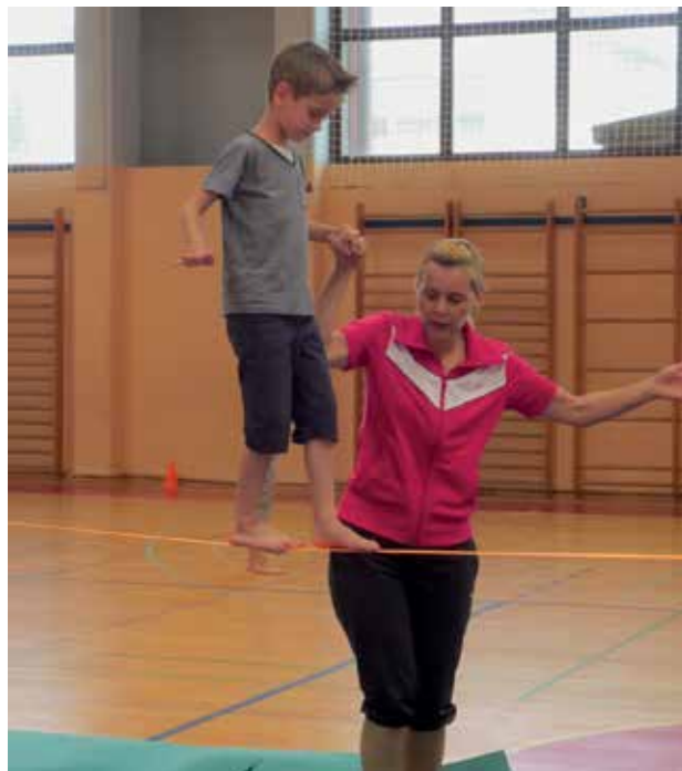
Slika 3: Športna aktivnost – hoja po vrvi.