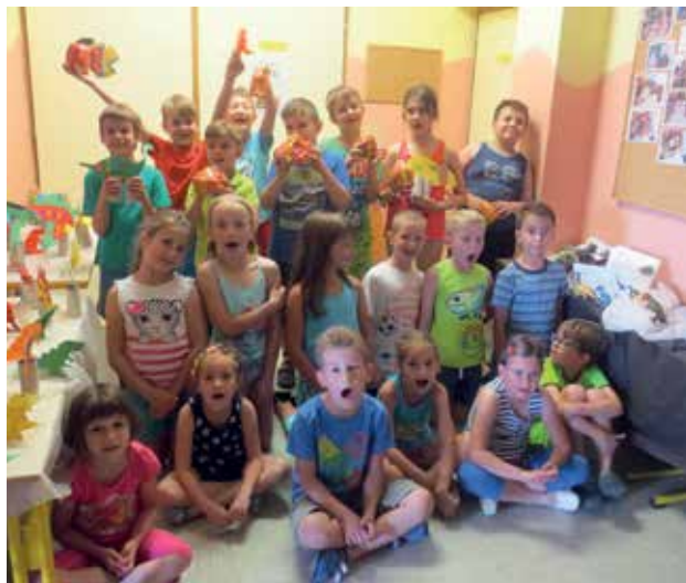
Slika 1: Udeleženci počitniških ustvarjalnic 2015/2016 – Igrajmo se zgodbo »V pradavnini«.

Počitniške ustvarjalnice so zasnovane tako, da učence skozi vse dejavnosti vodi zgodba, zato smo jih v podnaslovu poimenovali Igrajmo se zgodbo. Odločili smo se, da bomo vsako leto izhajali iz drugačne teme, ki se bo nanašala na vsakdanje življenjske situacije. Na vsako temo smo pripravili različne dejavnosti s področja književnosti, likovne umetnosti, tehnične vzgoje, lutkovno-dramskega ustvarjanja, glasbe, plesa, naravoslovja, kulinarike in športa.