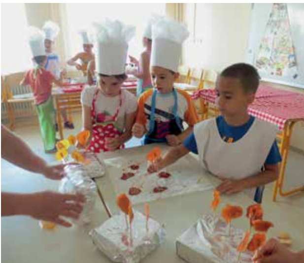
Slika 6: Kulinarska ustvarjalnica, priprava slaščic.

Ob tem so se vživljali v vloge klovnov, artistov, žonglerjev, cirkuškega orkestra ... V kulinarski delavnici pa sami ustvarili cirkuške slaščice in lizike.