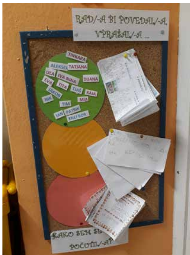
Slika 2: Tabla počutja, vprašanj, sporočil.