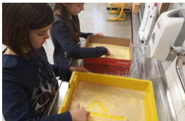
Slika 4: Pisanje v zdrob.