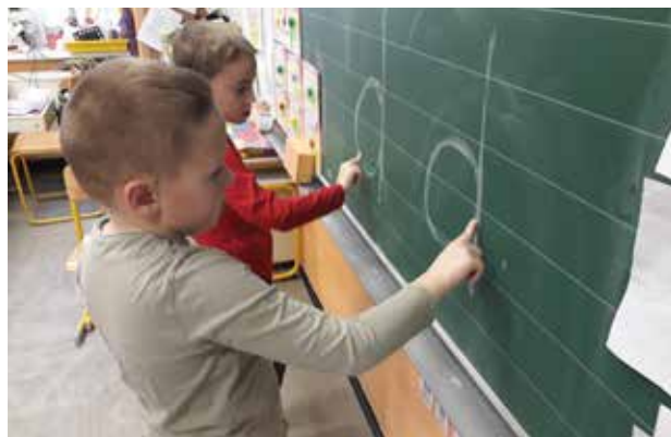
Slika 3: Delo po postajah – pisanje s prstom po tabli.

Prvi del učenja pisanja črk je pri mizi. Učenca v paru novo črko pišeta z velikimi gibi po zraku ( z iztegnjeno