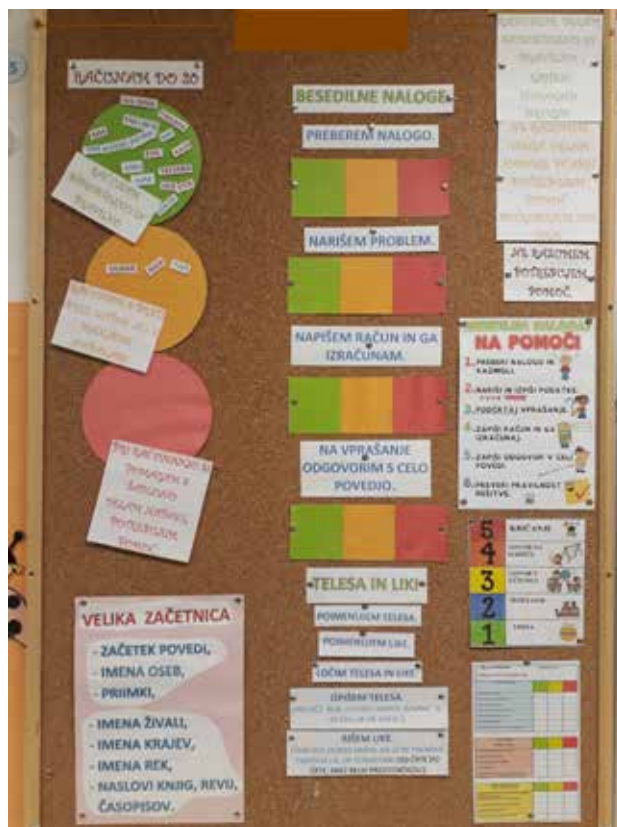
Slika 1: Tabla s kriteriji.