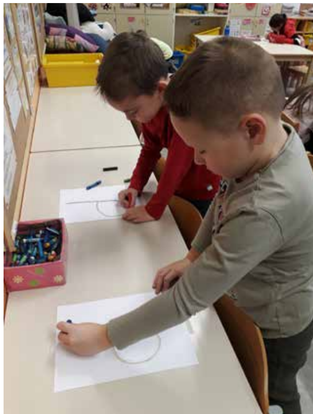
Slika 5: Pisanje z voščenko.