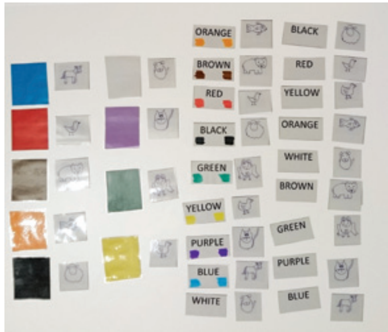
Igra spomin za različne skupine iz zgodbe Brown bear