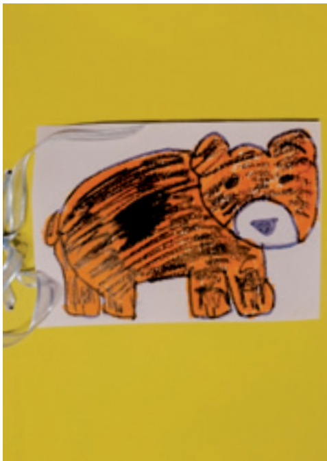
Izdelana knjižica Brown bear, brown bear, what do you see?