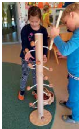
Slika 2: Orehi, orehi ali Drevo biserov

Oglejte si vsaj tri fotografije in zapišite nekaj dejavnosti, ki jih prepoznate.