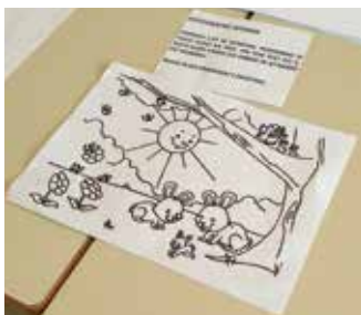
Slika 1: Fotografski spomin – orientacija na listu