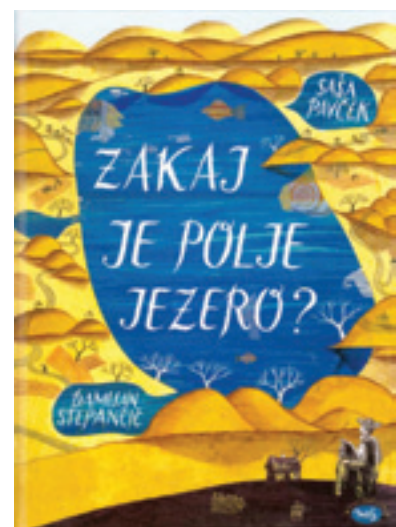
Vir: Pavček, Saša, Stepančič, Damjan (2014). Zakaj je polje jezero? Dob pri DOmžalah: Miš.