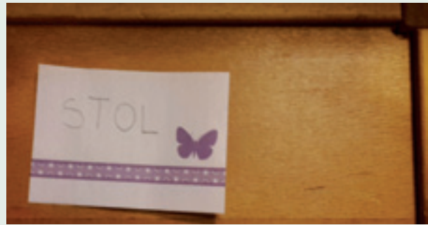
Samolepilni listki z zapisom besede (skrivnega sporočila)

Še en način, s pomočjo katerega preverim, kako otrok bere, je pisanje skrivnih sporočil. Igra gre tako, da na samolepilni listek napišem predmet. Otrok listek prebere in ga nese k predmetu. Če nese na pravo mesto, vem, da bere. Igra je zelo zabavna, če na listku pišejo zanimive oz. nenavadne stvari (npr. spenjač, stikalo ipd.). S to dejavnostjo se razvija tudi besedni zaklad. Igra se stopnjuje tako, da se na listek napišejo dejavnosti (pometanje, zalivanje) in lastnosti stvari (velik, rdeč). Lahko se pišejo tudi navodila (odpri vrata).