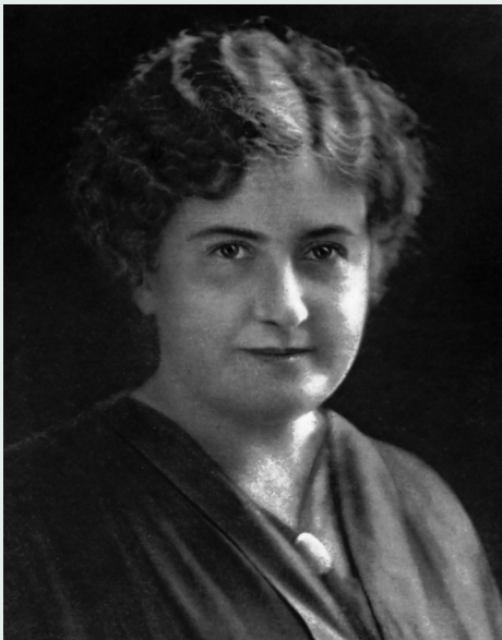
Dr. Maria Montessori, italijanska zdravnica in pedagoginja.