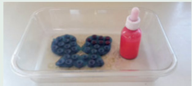
Delo z malo kapalko