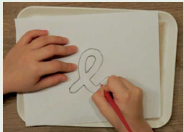
Predloga za pikanje

Pikanje otrokom pomaga razviti triprstni prijem (priprava na pisanje), koncentracijo in finomotorične spretnosti. V šoli otroci zelo radi pikajo. Za pikanje imam pripravljene predloge. Učenci si lahko podobo, ki jo bodo izpikali, sami narišejo, lahko pa uporabijo različne šablone in predmete. Na sliki je deklica obrisala pisano črko.