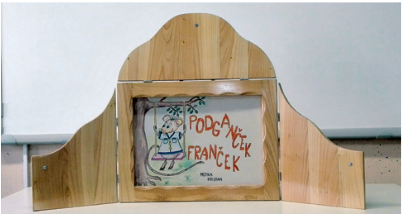
Slika 3: Dobra ilustracija nagovori gledalca