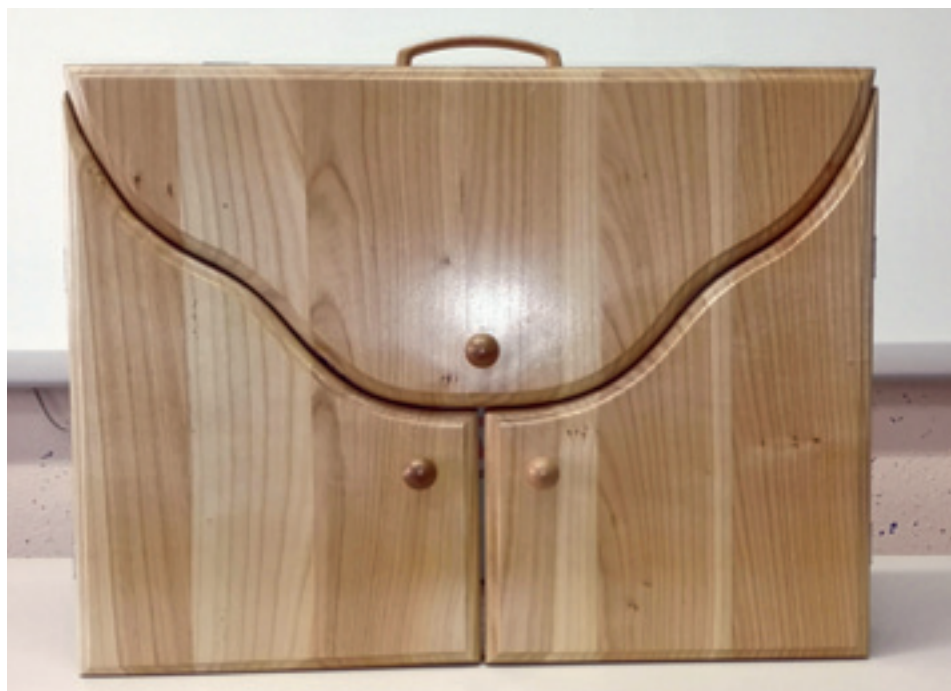
Slika 1: Kamišibaj gledališče

Ključne besede: gledališče, kamišibaj, slika, pripovedovanje, didaktični pripomoček