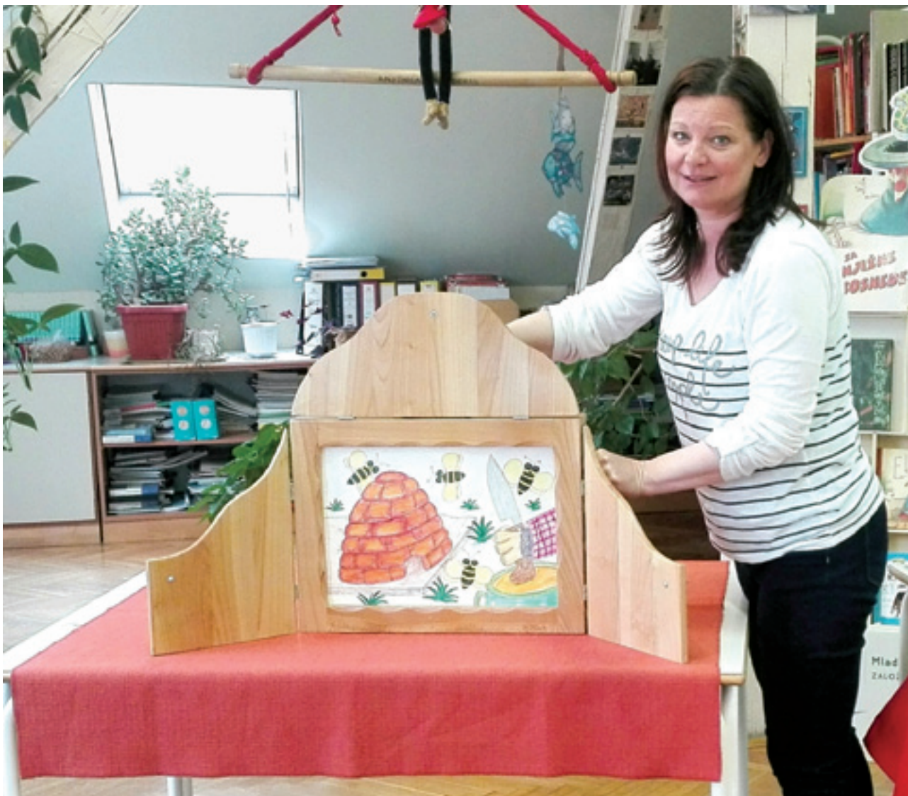
Slika 2: Pripovedovanje ob kamišibaj gledališču

oblikovanju in ustvarjanju predstave, krepi se tudi njihova ustvarjalnost, govorno izražanje, nabirajo izkušnje z javnim nastopanjem, pa še zabavno je.