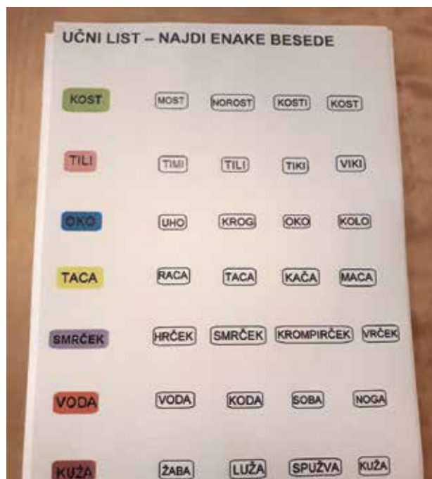
Slika 3: Učni list Besedni sudoku

Ko je večina učencev že usvojila vse črke abecede, sva z učiteljico načrtovali vaje za prepoznavanje črk, branje kratkih besed, branje po zlogih. Glede na stopnjo branja in prepoznavanje črk pri učencih sva pripravili diferencirano gradivo in aktivnost s Tili. Učenci so individualno obiskovali Tili v kotičku, ostale učence je vodila učiteljica. Za vsakega so bile pripravljene naloge. Naloge so bile namenjene povečanju motivacije za branje in razvijanju interesa za branje. V eni šolski uri se je razvrstilo od 4 do 5 učencev. Učenci, ki so že zelo