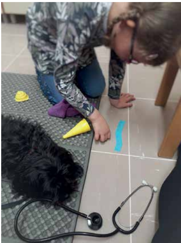
Slika 8: Naloga iz korneta