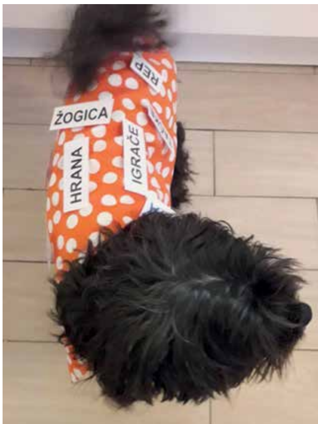
Slika 5: Tili s predpasnikom, besede na ježkih