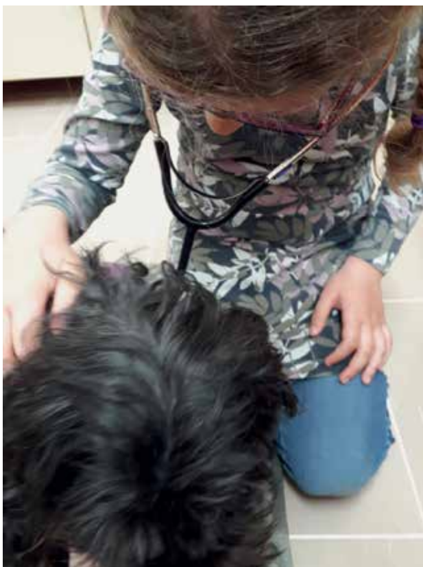
Slika 9: Učenka posluša Tilino bitje srca