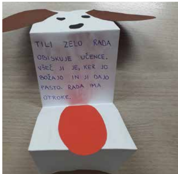
Slika 7: Zloženka