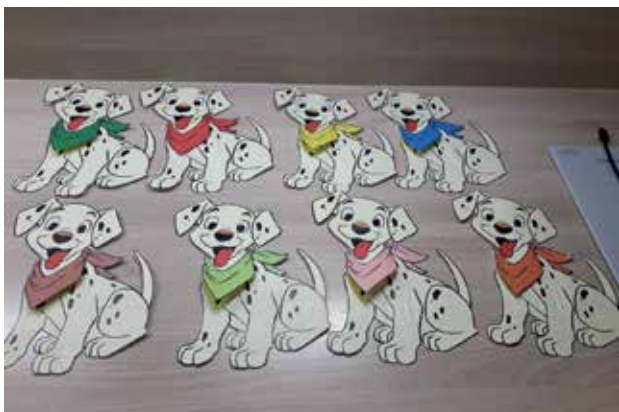
Slika 4: Besede pod rutami

vešč branja. Prisotnost živali ustvarja čustveno močno okolje« (Mreža Šolski Pes, b.d.).