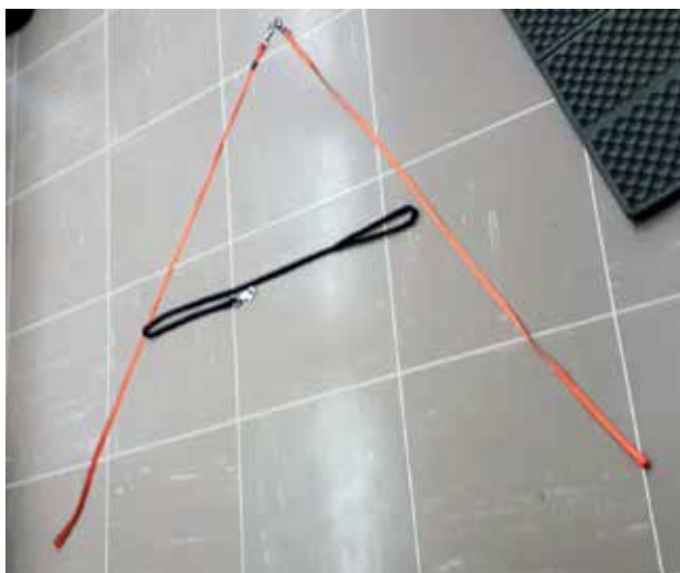
Slika 2: Oblikovanje črke A s povodci

Učenci so opazovali Tili in iskali pare na njej. Ugotovili so, da ima Tili dve očesi, dve ušesi, dve tački spredaj, dve tački zadaj, dve luknji v nosu. Pazili smo tudi na sklanjanje.