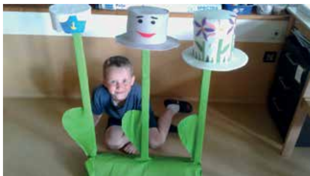
Slika 5: Klobuki na pecljih, avtorji Leo, Zoja, Maj.