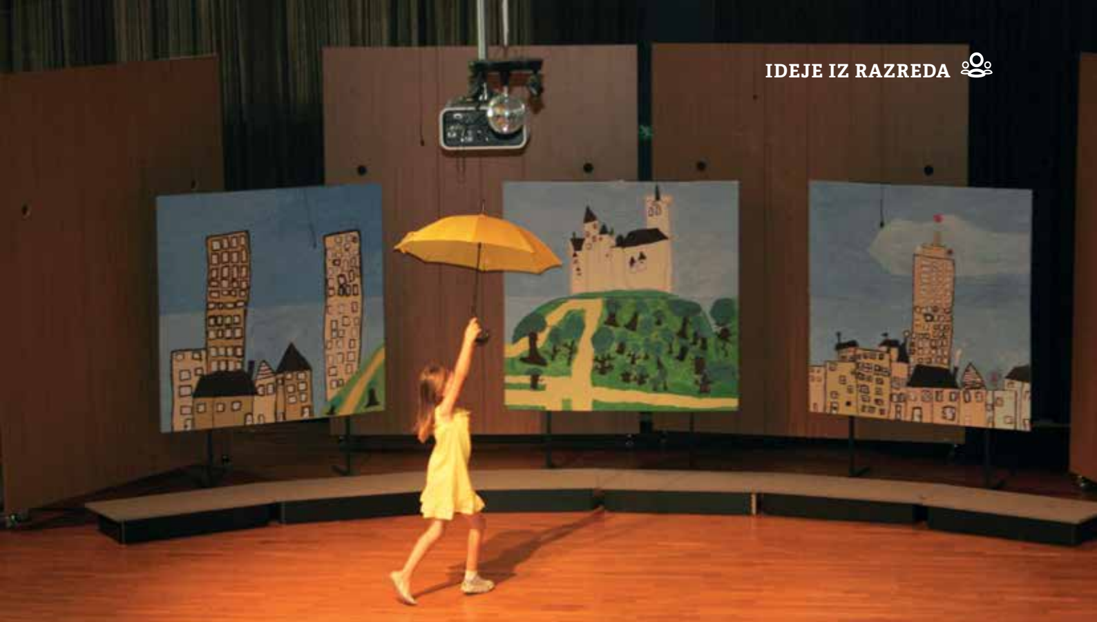
Slika 1: Jelka.