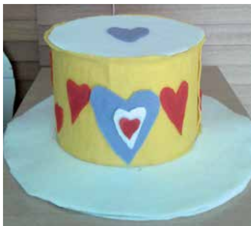
Slika 4: Balerinin klobuk, avtorica Maja.