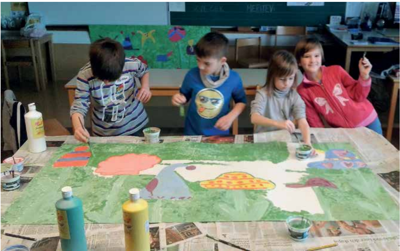
Slika 2: Skupinsko slikanje scene.