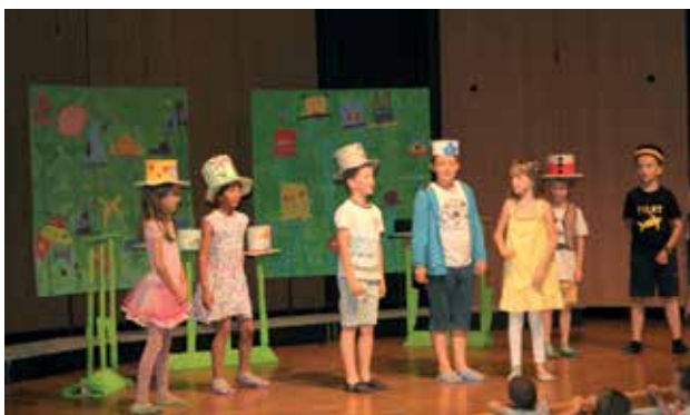
Slika 8: Dežela Klobučarija.