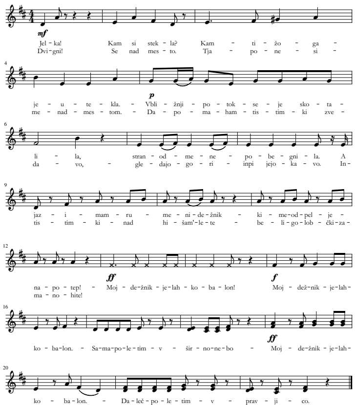
Slika 7: Rumeni dežnik.

dodalo ustvarjalnemu procesu širino, igralci so se znašli v različnih situacijah, ko so se morali na primer odzvati na praznino tišine, kajti uprizoritev gledališke igre je živ proces, ki ves čas neprekinjeno teče dalje. V začetni fazi vaj sem se osredotočala na izgovarjavo, jakost glasu in vživljanje v čustva posameznih likov, nato pa sem igralcem pustila svobodo, da so lik upodobili instinktivno, v skladu s svojim razumevanjem in čustvi. Skušala sem doseči, da liki oživijo, da se na šolskem odru odvija paralelni svet gledališča, čim bolj pristno doživeti.