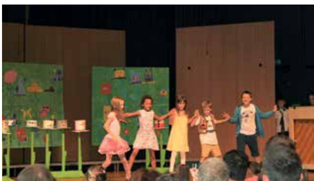
Slika 9: Ples v deželi Klobučariji.

pojavov (vršanje vetra, žuborenje potoka). Zvočno smo oblikovali tri glasbene teme z instrumentalno glasbo in šumi, ki so se v predstavi večkrat ponovile glede na kontekst ponavljanja posameznega prizora (npr. Jelka se pojavi na odru v različnih dogajalnih prostorih), kar je predstavi dalo dodatno strukturno dimenzijo.