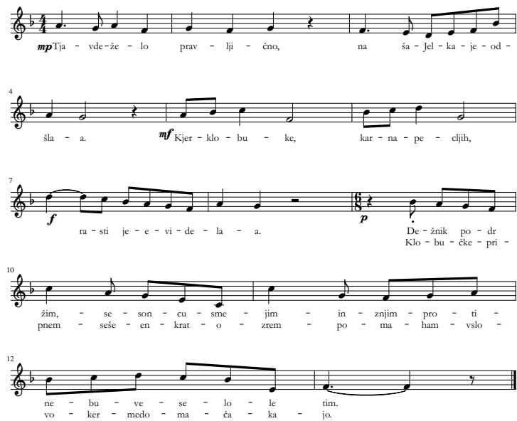
Slika 6: Pravljčna dežel.