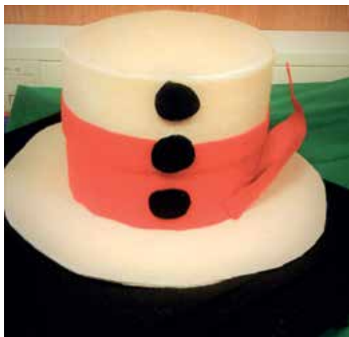
Slika 3: Šoferjev klobuk, avtor Aljaž.