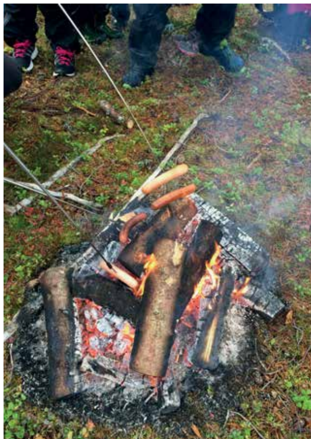
Slika 2: Prosta igra zunaj in taborni ogenj.