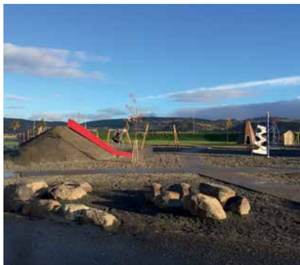
Slika 5: Igralna površina ob šoli.

V osnovnih šolah na Norveškem učenci običajno ne dobijo malice ali kosila, zato malico prinesejo od doma (t.i. lunch box). To velja tudi za dneve, ki jih preživijo v naravi. V krajih, ki jih obiskujejo, je vselej prisotno kurišče za taborni ogenj, ki ga učenci sami zakurijo in vzdržujejo. Ogenj v času obiska v naravi služi kot pripomoček za pripravo malice (popočen kruh, hrenovke, penice idr.), za gretje in kot zbirna točka.