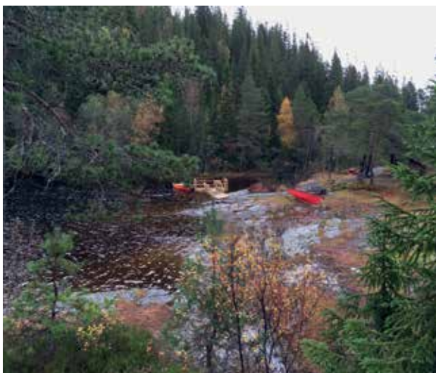
Slika 3: Igralna površina in nadzor nad učenci.

časa v naravi, ki je bilo ponekod delno usmerjeno ali pa popolnoma neusmerjeno. Na teh šolah so učenci od prvega do četrtega razreda vsak teden en dan preživeli zunaj in ne glede na vremenske razmere (primerna obutev, nepremočljive hlače in jakna) obiskali različne naravne habitate (gozd, naravno igrišče ob potoku, travnik idr.). Pri tem je treba poudariti, da za primerna oblačila poskrbijo starši, ne smemo pa pozabiti, da