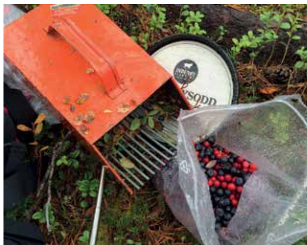
Slika 1: Usmerjena dejavnost – obiranje gozdnih jagod.

Med obiskom nekaterih norveških državnih šol sem dobila vpogled v njihov način izvajanja proste igre. To so omenjene šole popolnoma implementirale v preživljanje