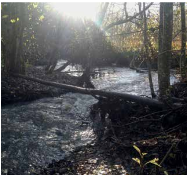
Slika 4: Igralna površina v gozdu.

Učitelji dan v naravi običajno združijo z urami, ki so namenjene prosti igri. Te ure se običajno odvijajo na določen dan v času rednega pouka skozi celoten učni