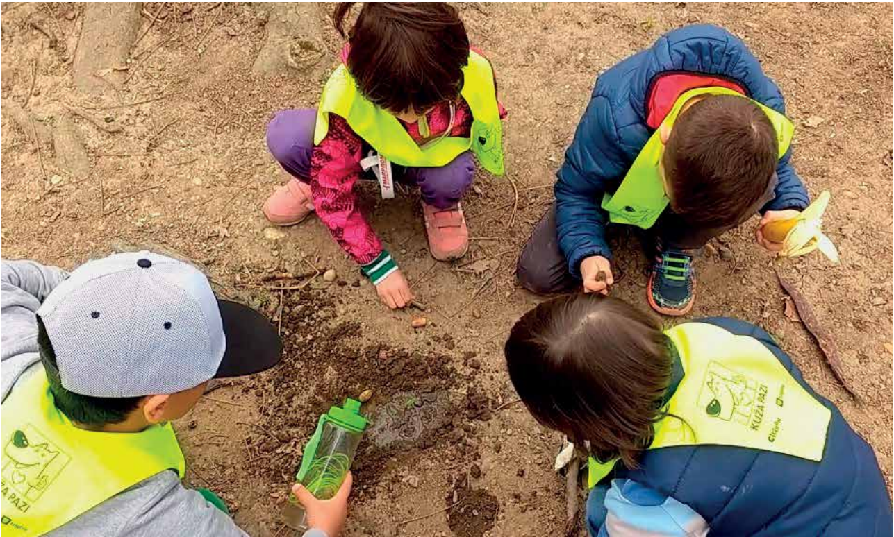
Slika 6: Prosta igra zunaj šole v Sloveniji (sejanje dreves in saditev dreves).

koncu dejavnosti sem učencem zastavila dve vprašanji: Kaj si počel(-a) med prosto igro? Kako si se počutil(-a)? Rezultati intervjujev so pokazali, da se učenci ob igranju na prostem počutijo dobro, srečno in zadovoljno. Svoje počutje so povezali predvsem z dejavnostmi, povezanimi z okoljem, v katerem so med prosto igro bili. Skrbeli so za drevesa, opazovali živali, sejali semena, iz katerih bodo zrastle drevesa, tekali, opazovali naravo, igrali nogomet, se igrali, da prodajajo rože in živali, lovili so živali, raziskovali, zbirali semena za ptice, skrbeli za živali in iskali palice. Nekateri učenci so svoje počutje povezali z dejavnostmi, ki niso bile neposredno povezane s konkretno interakcijo posameznika z naravo. To se je odražalo v naslednjih igrah: domišljajska igra plenilec in plen, gimnastika, pogovarjanje s prijatelji, opazovanje sošolcev med igro, pripovedovanje šal in pisanje.