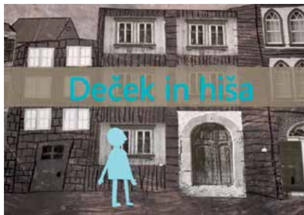
Slika 2: Kader iz animiranega filma.

Liki, ki so jih učenci oblikovali za animacijo, so bili deček, deklica, mačka in trije pešci. Šest likov je bilo izbranih zato, da je vsak učenec lahko oblikoval svojega in ga tudi animiral. Ob likih so učenci oblikovali različna ozadja oz. scene, ki so jih poustvarili po izbranih ilustracijah iz slikanice. Pri oblikovanju posameznih scen so učenci z mentorjem želeli poustvariti prevladujoče razpoloženje v slikanici. Tople harmonične odnose so dosegli tako, da so učenci papirje pred oblikovanjem premazali s sorodnimi barvnimi odtenki. Barvo so nanašali s širokimi čopiči in pršenjem površin. Tako pripravljene podlage so obdelali s pomočjo fotokopij in risbe z belo in črno voščenko. Pri oblikovanju treh glavnih likov so se učenci z mentorjem odločili, da bodo barvo uporabili kot simbol. Deček je modre barve, kar simbolizira razum, deklica je rdeče barve kar simbolizira čustva, mačka pa je črne barve in predstavlja magičnost in skrivnostnost (slike 2–4).