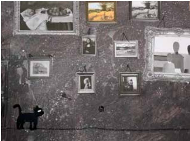
Slika 3: Kader iz animiranega filma.

mačka lovi ptico in pade deklici na glavo. Animacija je nastala po principu stop-motion animacije. Učenci so si med animiranjem delili naloge. Tisti, ki niso bili aktivni pri animiranju likov, so skrbeli za osvetlitev in snemanje s fotoaparatom.