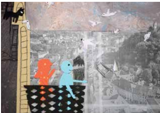
Slika 4: Kader iz animiranega filma.

Montaža je potekala tako, da so pri tem sodelovali vsi učenci, mentor jim je nudil le tehnično pomoč. Največ težav so imeli učenci s smiselnim povezovanjem kadrov in sekvenc v enotno tekočo zgodbo. K temu problemu so pristopili po načelu poizkusa in napake. Prizore so montirali večkrat, in sicer dokler niso bili zadovoljni s hitrostjo menjave slik in prehodi. Montažo so izvedli s pomočjo programa Movie maker .