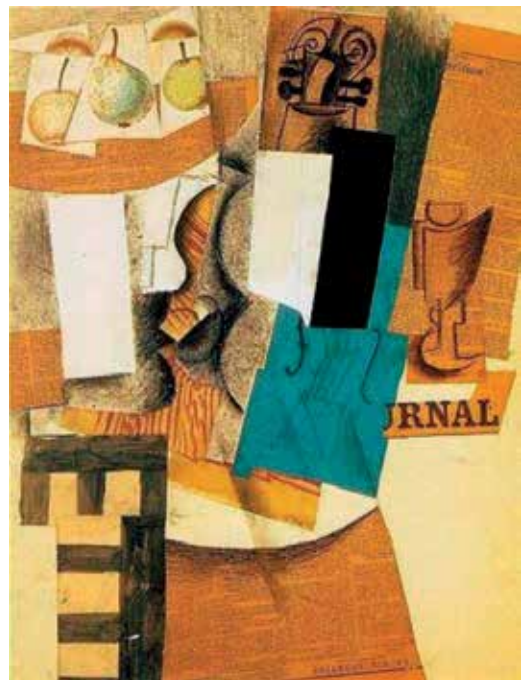
Slika 9: Picasso - collage

Pri drugi likovni nalogi so učenci v dvojicah oblikovali kolaž. Delo v parih sem izbrala zato, da si učenci pomagajo pri tehnični izvedbi, debatirajo, se posvetujejo, usklajujejo in tako navajajo na timsko delo, da spoznajo, kako se lahko dobre ideje medsebojno bogatijo in dopolnjujejo. Poleg tega takšen način vnaša določeno dinamiko v učni proces in učence povezuje. Za motivacijo in informacijo sem zopet uporabila splet. S pomočjo projekcij kolažev je bila učencem dana možnost, da se seznanijo s slikarsko tehniko in možnostmi lepljenja različnih materialov, z deli umetnikov in njihovo sporočilnostjo, ne pa, da jih posnemajo.