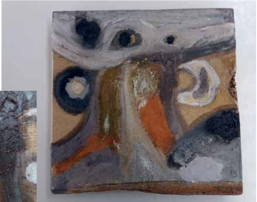
Slika 4: Patricija Planko, 5. b, Drevo zaščite