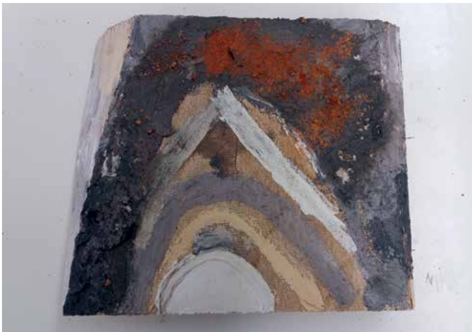
Slika 5: Patrik Pečarič, 5. b, Harmonična mavrica