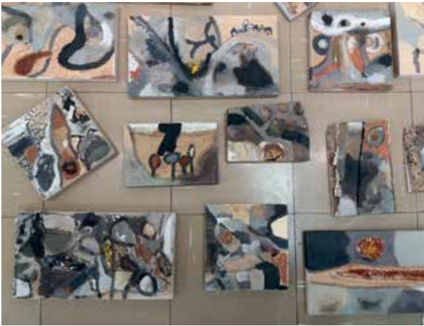
Slika 6: Slike učencev 5. b, II. OŠ Celje, tehnika – raznobarvne zemlje na lesu, mentorica Marija Cenc