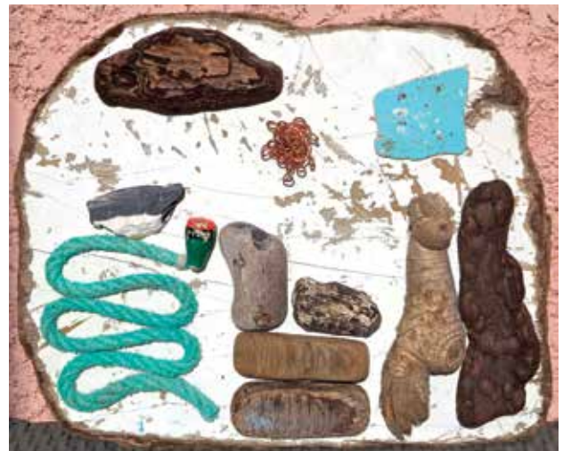
Slika 10: Aleksandar Obradović, Plein Soleil, collage