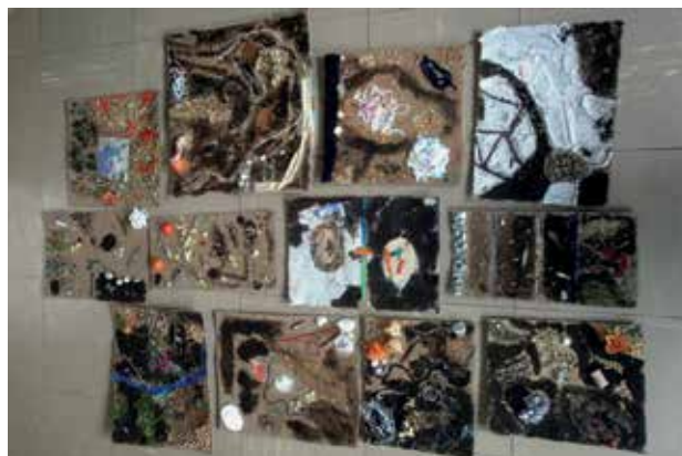
Slika 15: Kolaži učencev 5. b, II. OŠ Celja, mentorica Marija Cenc

sporočilnost. Pri zasnovi likovnega problema kolaža kot umetniškega dela in likovne tehnike, ki pogosto vstopa v tretjo dimenzijo, je tu glavni nosilec materialni vidik, zato je bil problem zasnovan tudi na slikarski tehniki. Idejna zasnova pa je bila koncipirana tako, da so učenci pri analizi lastnih likovnih izdelkov prišli do novih znanj o likovnih pojmi (kolaž, barvni kontrasti), ki so jih tekom procesa uporabljali, ozavestili pa po zaključku likovne naloge.