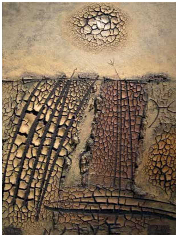
Slika 3: Tone Lapajne, Barjanska zemlja. Vir: Tone Lapajne - Njive barjanska zemlja / juta, 80 x 64,5 cm, 1987.

Vse to lahko učitelj na razredni stopnji dobro izkoristi, saj se z medpredmetnim povezovanjem učne vsebine med seboj bogatijo, oplajajo in kot take nudijo učencu kompleksen pogled na obravnavano snov. Ustvarjalni učitelj, ki zazna likovne prvine, motive, materiale ... , jih v vsebinah posameznih predmetnih področjih lahko uporabi kot idejo za realizacijo likovne naloge. Poleg tega pa afiniteto, ki jo ima do posameznih predmetov, vnese v likovne vsebine, s tem sproža nove ideje in motivira učence. To sem izkoristila v petem razredu, kjer so se učenci pri naravoslovju in tehniki ter družbi učili o značilnostih Zemlje in zemlje. Snov ponuja mnogo možnosti za raziskovanje na različnih nivojih in področjih. Odločila sem se, da pri likovni umetnosti nova spoznanja nadgradim, da učenci spoznajo tudi estetsko plat različnih zemljin in njihovo uporabo pri izvedbi likovne naloge. V mesecu aprilu, ko praznujemo dan Zemlje, sem izvedla dve likovni nalogi, povezani z zemljo – prstjo.