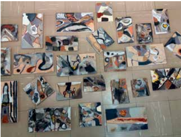
Slika 7: Slike učencev 5. b, II. OŠ Celje, tehnika – raznobarvne zemlje na lesu, mentorica Marija Cenc