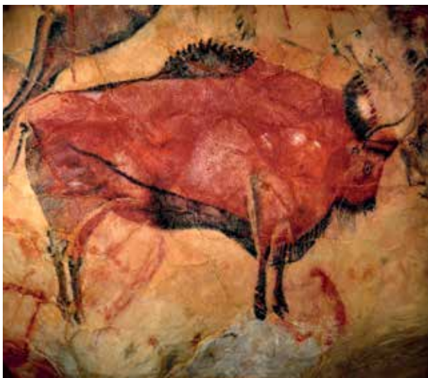
Slika 2: Altamira, Bizon.

Na nek način sem jim pojasnila, da nam informacije in ideje s spleta marsikaj olajšajo, da pa: »Resnična znanja ni mogoče pridobiti s pomočjo brskanja ali preletavanja po medmrežju, ampak z aktivnim pojasnjevanjem, umskim tehtanjem in z vedno novim gnetenjem, s postavljanjem pod vprašaj, analiziranjem in novim spajanjem vsebin.« (Spitzer 2016, str. 193, 194).