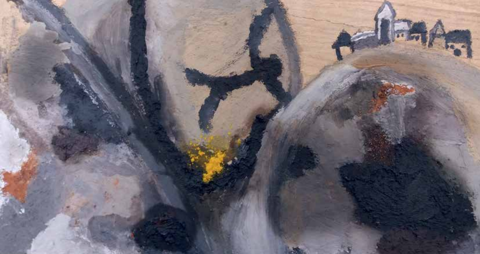
Slika 1: Tija Jesenšek, 5. b, Novi svet