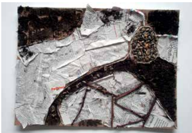
Slika 12: Lan Oset, Tian Zupanič, 5. b, Black and white, kolaž