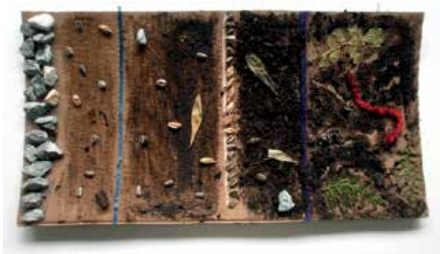
Slika 13: Jan Klanšek, Janik Kovač, 5. b, Plasti Zemlje, kolaž