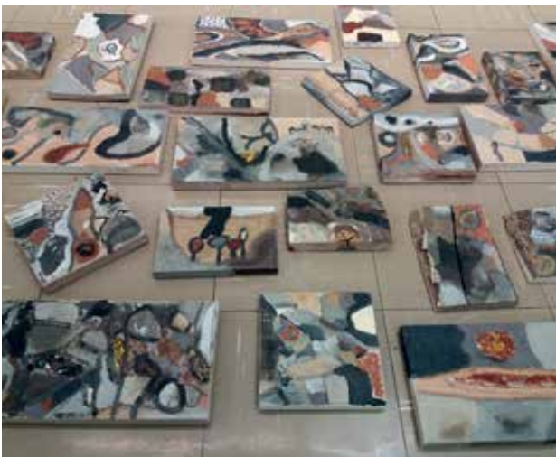
Slika 8: Slike učencev 5. b, II. OŠ Celje, tehnika – raznobarvne zemlje na lesu, mentorica Marija Cenc

Pri drugi likovni nalogi so učenci v dvojicah oblikovali kolaž. Delo v parih sem izbrala zato, da si učenci pomagajo pri tehnični izvedbi, debatirajo, se posvetujejo, usklajujejo in tako navajajo na timsko delo, da spoznajo, kako se lahko dobre ideje medsebojno bogatijo in dopolnjujejo. Poleg tega takšen način vnaša določeno dinamiko v učni proces in učence povezuje. Za motivacijo in informacijo sem zopet uporabila splet. S pomočjo projekcij kolažev je bila učencem dana možnost, da se seznanijo s slikarsko tehniko in možnostmi lepljenja različnih materialov, z deli umetnikov in njihovo sporočilnostjo, ne pa, da jih posnemajo.