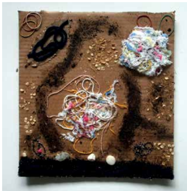
Slika 14: Asja Immanović, Ema Androvič, 5. b, Onesnaževanje, kolaž