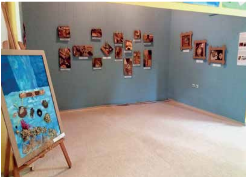
Slika 16: Razstava slik učencev 5. b v šolski galeriji Modra niša

program ob odprtju razstave v šolski galeriji ob dnevu Zemlje.