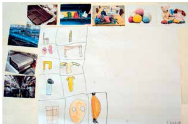
Slika 1: Predstavitev tovarne z risbo in fotografije, ki jih je učenec povezal s tovarno (A. Jurca, 2017).

O tovarnah so učenci razmišljali pri risanju tovarne ter prirejanju fotografij svojim risbam. Na voljo so imeli 25 fotografij. Zelo raznolike fotografije so poskusili povezati s tovarno in povezavo pojasniti (Slika 1). To dejavnost so opravljali trikrat in pri tem širili in povezovali pojmovno mrežo okoli pojma tovarna.