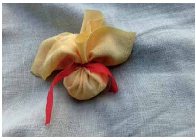
Slika 3: Vrečka z dišečo kopalno soljo kot primer VITR.

Kot že rečeno, koncept trajnostnega razvoja in posledično tudi VITR vključuje tri pomembne stebre: družbo, okolje in gospodarstvo (Adams, 2006). Združevanje tega je v šoli mogoče udejanjiti s preprosto dejavnostjo, kot je izdelovanje vrečke z dišečo kopalno soljo (Slika 3).