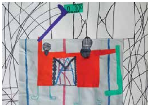
Tabela 7: Možnosti medpredmetnega načrtovanja v četrtem razredu in primeri likovnih nalog