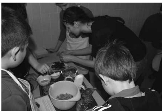
Slika 3: Priprava hrane po rimskih receptih.

Vznemirjenje se je preneslo v popoldanski čas, ko so učenci pod vodstvom vseh strokovnih delavcev, sodelujočih v projektu, svoje delo predstavili staršem in krajanom. Prikazali so vojaške spretnosti in plese. Na ogled so postavili razstavo izdelkov, ki so nastajali v času projekta, in jo predstavili. Pripravili so pokušino rimskih jedi ter predstavili hrano in recepte. Na koncu pa smo si vsi ogledali še kratek film, ki je bil posnet med projektom. Vsi prisotni so bili nad rezultati projekta navdušeni in hkrati nemalo presenečeni, koliko novega znanja so v tem obdobju osvojili njihovi otroci, katere veščine so razvili in kako spretno in izvirno so bili izdelani številni izdelki, na katere so bili tudi učenci ponosni. To so pokazali s tem, da so jih želeli čim prej odnesti v varna domača zavetja. Žal jim nismo mogli ustreči, saj je bila razstava postavljena na ogled še nekaj dni za vse, ki se predstavitve niso udeležili.