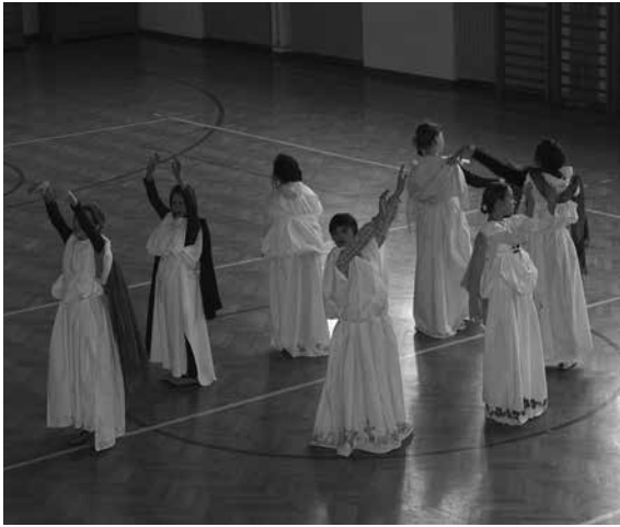
Slika 5: Ples rimskih deklet.

Projekt je imel številne pozitivne učinke, med drugim je navdihnil učence 3. e razreda, ki so pod mentorstvom razredničarke v naslednjem šolskem letu napisali knjigo 2014 korakov . Knjiga je prejela nagrado na mednarodnem natečaju za najboljšo otroško in mladinsko knjigo v Avstriji. Tudi na natečaju za najboljše literarno glasilo, literarne zbornike ter knjige, ki ga v okviru Roševih dni razpisuje revija Mentor , ni ostala neopažena. Po končanem delu smo se z učenci pogovorili o njihovih vtisih o projektu, pri čemer je vsak od njih povedal, kateri del mu je bil najljubši in kateri najmanj. Zanimale in navduševale so jih različne stvari, vsi pa so izpostavili, da so imeli najraje praktični del, ko so izdelovali različne izdelke. Ugotavljali smo tudi, kaj jim je povzročalo največ težav. V 5. a so bila to rimska imena, v 5. e pa oblačila.