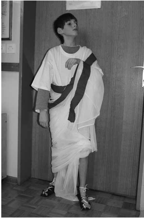
Slika 1: Učenec, urejen po modi rimskega senatorja. Togo in čevlje je izdelal sam (foto: Jasna Furlan).

V drugem rimskem dnevu smo spoznavali rimsko družino, otroštvo in šolanje. Učili smo se branja različnih virov, prvič smo se lotili tudi branja epigrafskih spomenikov, na podlagi katerih smo skušali odkriti zakonitosti rimskega poimenovanja, ob opazovanju slike rimskih otrok pri pouku pa ugotoviti značilnosti rimskega pouka (kdo je udeležen, kje poteka pouk, katere didaktične pripomočke so uporabljali ...). Preiskusili smo se tudi v igri vlog. Zavrteli smo časovni stroj in se preselili v rimsko šolo, kjer smo s pisali na voščene tablice. Spretnosti in veščine smo urili tudi pri izdelavi mozaika.