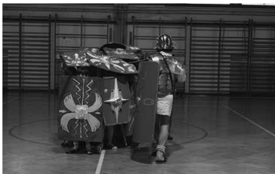
Slika 4: Rimska vojska – formacija »Želva«.