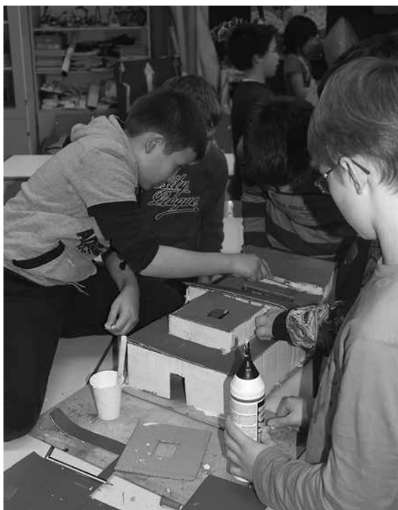
Slika 2: Učenci so pri izdelavi makete rimskega doma – kljub temu da je bila njihova naloga predstaviti le zunanost stavbe – samoiniciativno dodali detajle, ki jih je bilo mogoče videti skozi odprtine v strehi: bazenček v atriju in drevesa na zunanjem vrtu doma.

Peti dan ali »finale« je bil za učence še posebej zanimiv. Najprej smo brali kratka besedila: odlomek Tacitovih Analov , ki govori o uporu vojakov na slovenskem ozemlju, ter odlomek Petronijevega Satirikona , ki daje vtis veličastnosti rimskih gostij. Delo se je nadaljevalo v dveh skupinah, ločenih po spolu. Deklice so se spretno lotile priprave različnih jedi po rimskih receptih, fantje pa so se v tem času učili osnovnih vojaških formacij in bojnih taktik. Rimski legionar (član društva Vespesjan ) jim je v predstavi predstavil osnovne značilnosti rimske vojske in osnovne vojaške taktike. Nato je skupino učencev postrojil v vrsto in jih naučil osnovnih ukazov, korakanja in formacijo želve ( testudo ). Uprizorili so pravi spopad dveh vojaških skupin. V drugem delu priprav na predstavitev projekta sta se skupini zamenjali. Deklice so ponovile rimske plese, ki so se jih naučile že prej pri pouku, dečki pa so novo pridobljene vojaške spretnosti nadgradili v šolski kuhinji ob pomoči učiteljice gospodinjstva in se »spopadli« s kuharskimi recepti rimskodobne hrane.