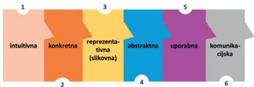
Shema: Stopnje/koraki obvladovanja matematične veščine

Za razumevanje avtomatizacije poštevanke je z didaktičnega vidika treba razumeti tudi stopnje obvladovanja matematične veščine (Sharma, 1990). Prikazuje jih spodnja shema: